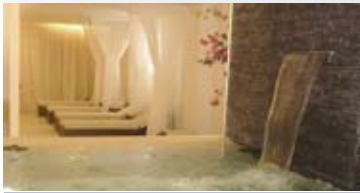
BENESTAR, SALUT I BELLESA

Obert de dilluns a dissabtes 9.15 hores a 21.15 hores i diumenges de 10 a 14 h. www.qualia.cat