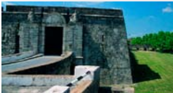
SORTEIG D'UN DINAR O SOPAR

De dilluns a dijous 9-17h Divendres i dissabtes de 8h a 1h