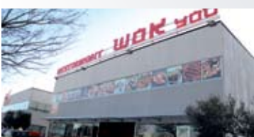
UN MENÚ PER A 2 PERSONES

SI ENCARA NO ETS SUBSCRIPTOR, FES-TE'N TRUCA ARA MATEIX AL 972 505 958 I BENEFICIA'T D'UN MUNT D'AVANTATGES MÉS