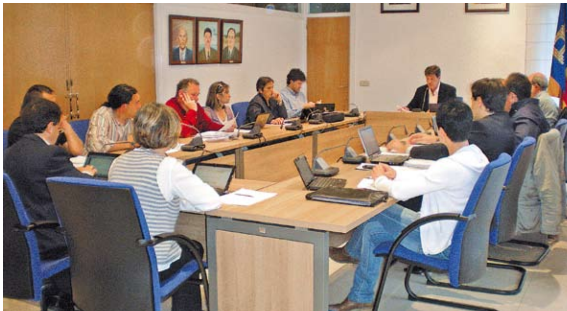
L'ESCALA. L'any passat l'Ajuntament ja va reformar la sala de plens en previsió de l'augment de regidors

D'altra banda, tal com va avançar HORA NOVA fa unes setma-