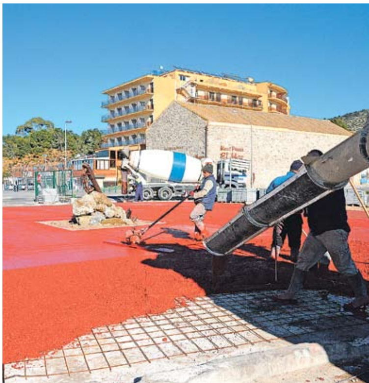
EL NOU ESPAI. Ports ha assumit el cost i l'execució d'aquesta vorera