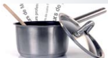
1 XEC REGAL PER PERSONA

Sorteig de 10 xecs regal per a realitzar qualsevol curs a l'Escola d'Hostaleria