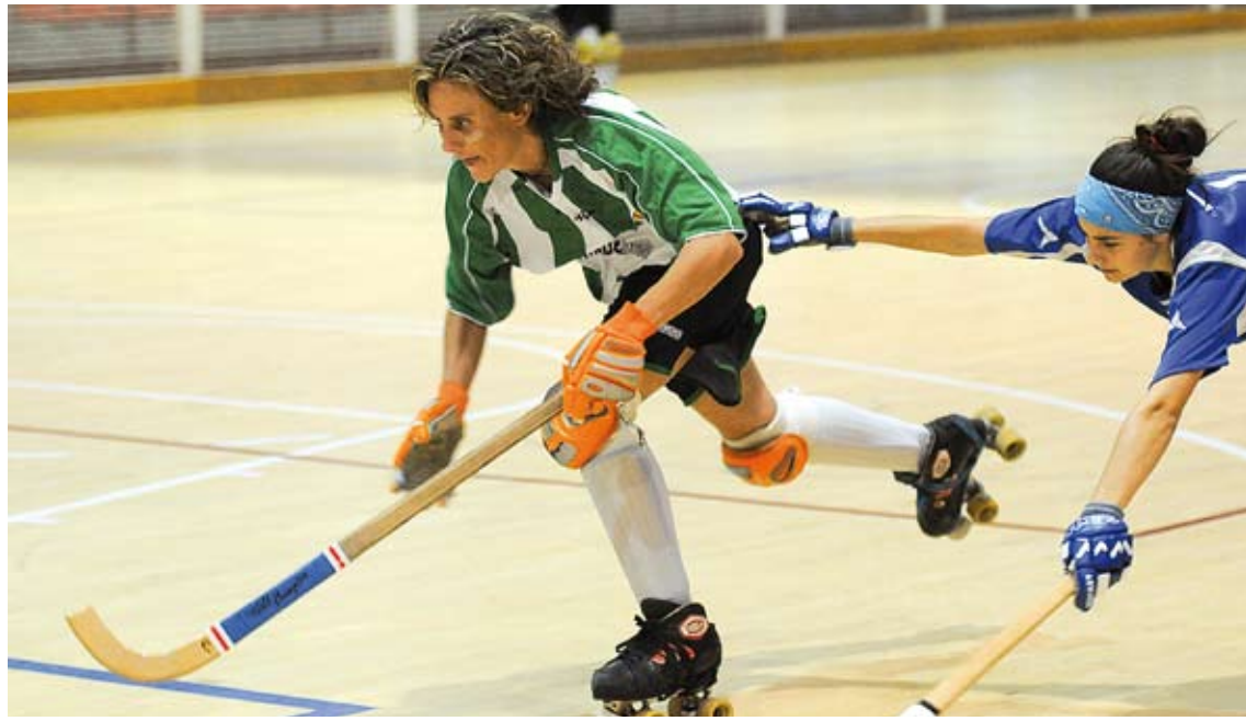
REMUNTADA. L'equip femení del CP Jonquerenc es va refer d'un mal primer temps i va superar l'Arenys de Mar