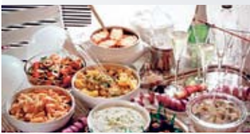
UN ÀPAT PER A 2 PERSONES

Una àmplia oferta de plats per gaudir d'una bona estona a taula tant per dinar com per sopar