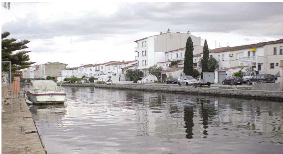
ALS CANALS. Els nous portaveus es van mostrar sorpresos per l'afectació de l'atermenament i la volen comprovar 'in situ' G. ARCHÉ