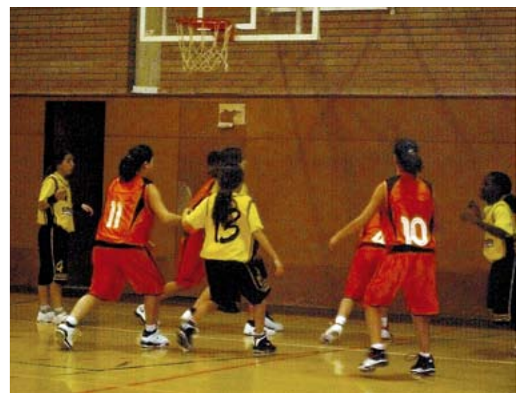
DERBI. Les jugadores del Bàsquet Esplais van superar les del Castelló