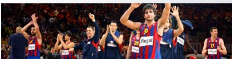
SORTEIG D'ENTRADES DOBLES