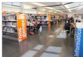
Diputació de Girona

Llegir un bon llibre acompanyat d'una copa de vi és un plaer que a partir d'ara també es podrà gaudir més enllà de la intimitat de la llar. La responsabilitat és del Servei de Biblioteques de la Diputació de Girona que ha organitzat una trobada de grup de lectura a través d'un maridatge combinat amb lletres i vi. La primera experiència d'aquest projecte es realitzarà aquest ferber a la biblioteca Francesc Ferrer i Guàrdia de Caldes de Malavella amb la presència d'escriptors, sommeliers i actors. L'objectiu és que l'activitat s'estengui a d'altres biblioteques de la província que disposen de clubs de lectura. Neix, d'aquesta manera, una nova manera de viure la lectura a Girona: Vinoteca: maridatge entre la lectura i el vi.