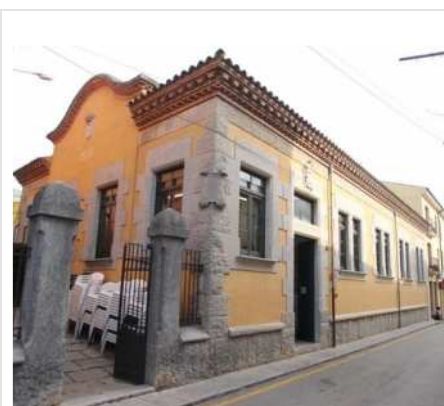
Diputació de Girona

L'activitat està oberta a tothom. Tant si es comença de zero com si ja s'ha participat en desenes de tertúlies. Així els assistents poden participar com a