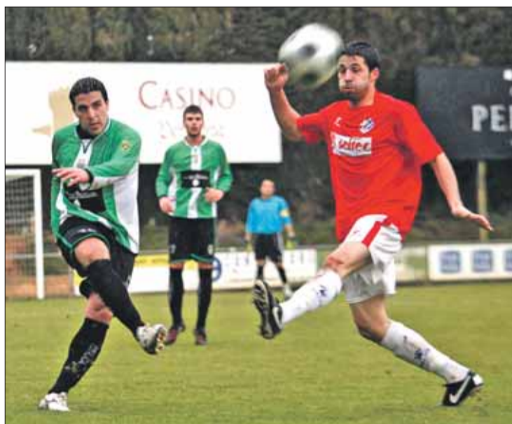
El Peralada va tombar el Blanes a casa diumenge passat. ROGER LLEIXÀ

■ El Peralada es va imposar, diumenge, al Blanes en un partit que va tenir una primera meitat molt igualada. El Peralada va disposar d'ocasions a les botes de Pol i Sergi Arranz, però un Blanes molt ben posat sobre el camp va dificultar la feina dels locals i també va disposar d'alguna ocasió, sobretot a les botes de Mario, però la defensa local va impedir qual-