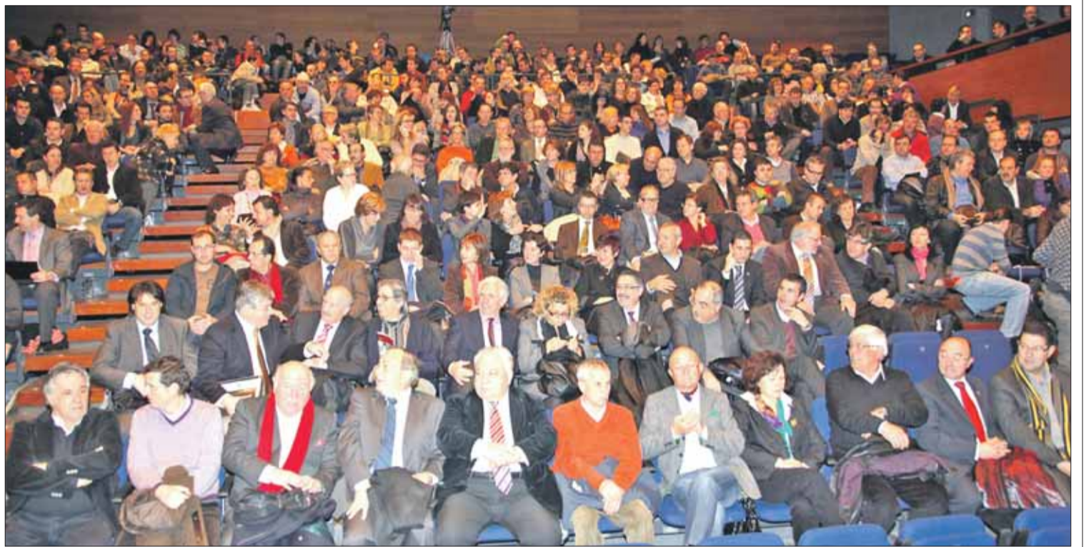
El Teatre Municipal va aplegar al voltant de 400 assistents de tota la demarcació per conèixer la nova aposta del xef Ferran Adrià.

El proper 30 de juliol serà el darrer dia d'El Bulli restaurant, l'endemà ja serà El Bulli Foundation, però no serà fins al 2014 quan reobri les seves portes. El pretigiós xef va voler desmitificar el concepte que es té d'aquest futur ens privat en la societat espanyola, relacionat amb el blanqueig de diners. Així mateix va afirmar que és un projecte on hi tenen cabuda totes les empreses i els partits polítics, que són "els que han de fer coses i no deixar-ho tot en mans de l'administració".