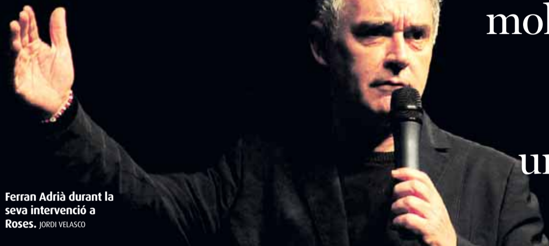
Ferran Adrià durant la seva intervenció a Roses.

COPROPIETARI D'EL BULLI I COIMPULSOR D'ELBULLI FOUNDATION