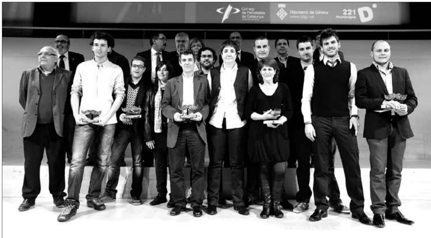
Una imatge de grup amb tots els guanyadors dels segons premis de comunicació local Carles Rahola. ROGER LLEIXÀ