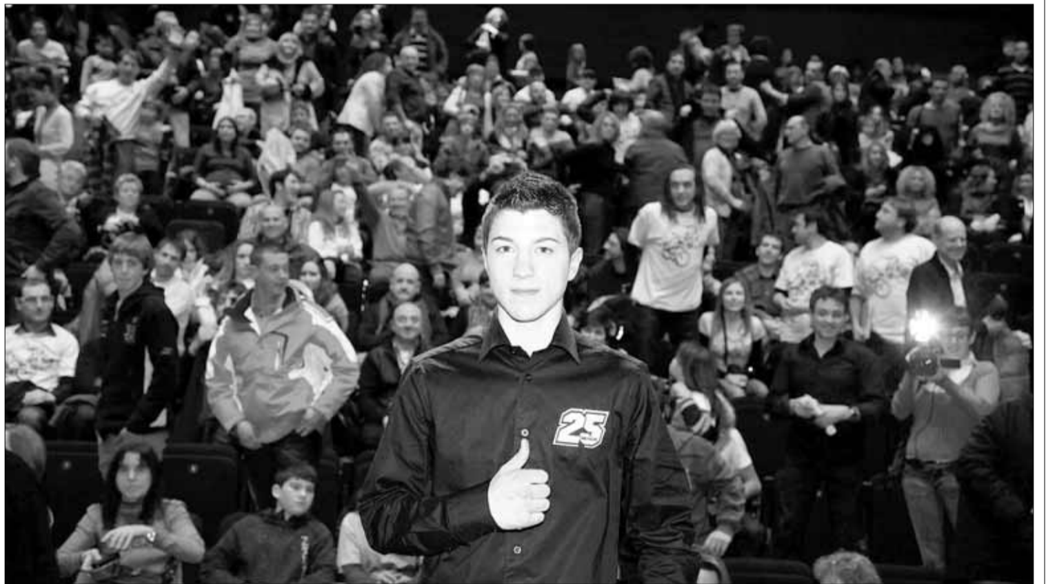
Maverick Viñales en primer terme amb els seus seguidors darrera seu, aquest dissabte a la nit, al Teatre Municipal de Roses.