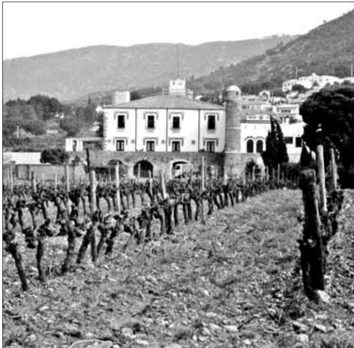
El mas d'en Coll, una de les masies catalogades a l'estudi. MARGA FIGUERAS

La catalogació respon a criteris urbanístics i arquitectònics i estableix les normes per a fer fu-