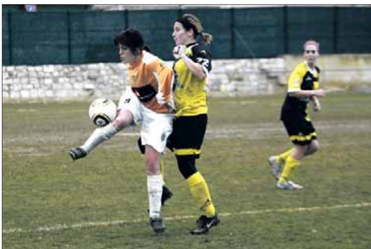
Una acció del partit de dissabte a Peralada.