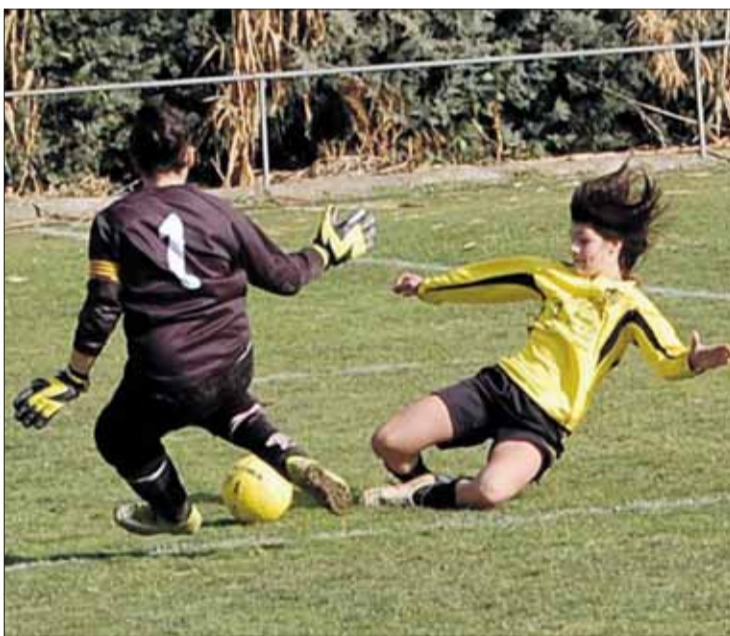
Una jugada d'un partit del Cabanes femení.