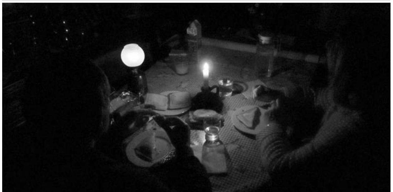
Un gràfic amb els pobles que ahir encara no tenien llum des de dilluns i una imatge de gent sopant, a Platja d'Aro.

● La companyia tenia ahir en servei 280 generadors i procedia a la instal·lació de 39 més, però els grups electrògens acumulaven diversos problemes. La problemàtica era, sobretot, que molts dels generadors es quedaven sense el gasoil que necessiten per poder funcionar. L'empresa havia establert un servei especial per anar a reposar gasoil, però no donava l'abast, i molts alcaldes rebien trucades de veïns que es queixaven que els grups electrògens no funcionaven. A més, començava a haver-hi problemes també perquè els camions que repartien la gasolina s'anaven quedant sense combustible per transportar, a causa de la gran demanda que s'ha generat aquests dies per la presència massiva de generadors. A més, alguns ciutadans alertaven que s'havia produït algun furt de gasoil dels mateixos generadors, cosa que complicava encara més la situació.