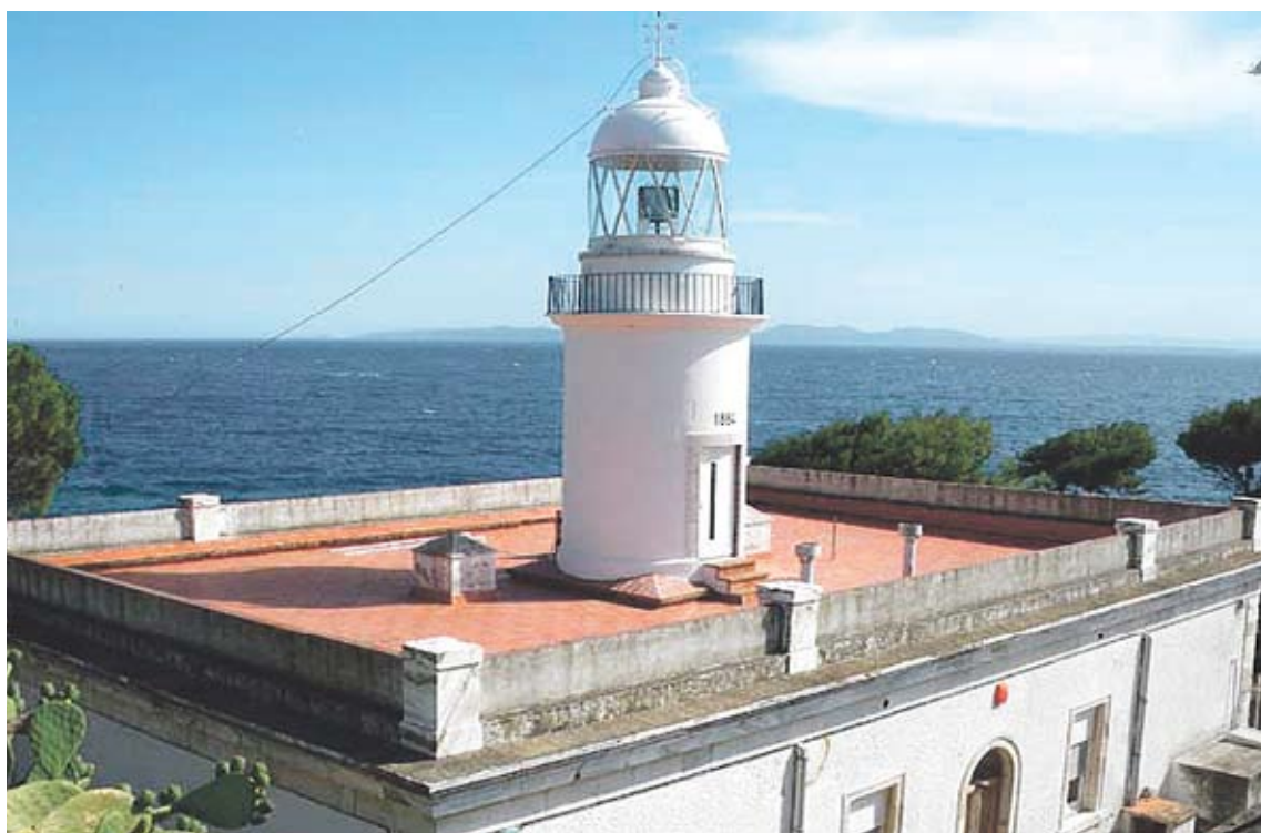
FAR DE ROSES. L'emblemàtic edifici està situat en un lloc privilegiat del municipi

El projecte de rehabilitació preveu els usos de serveis de vigilància marítima, un espai cultural polivalent de tres sales per exposicions i conferències i una zona dedicada a la recerca, bàsicament sobre temes marins. El pressu-