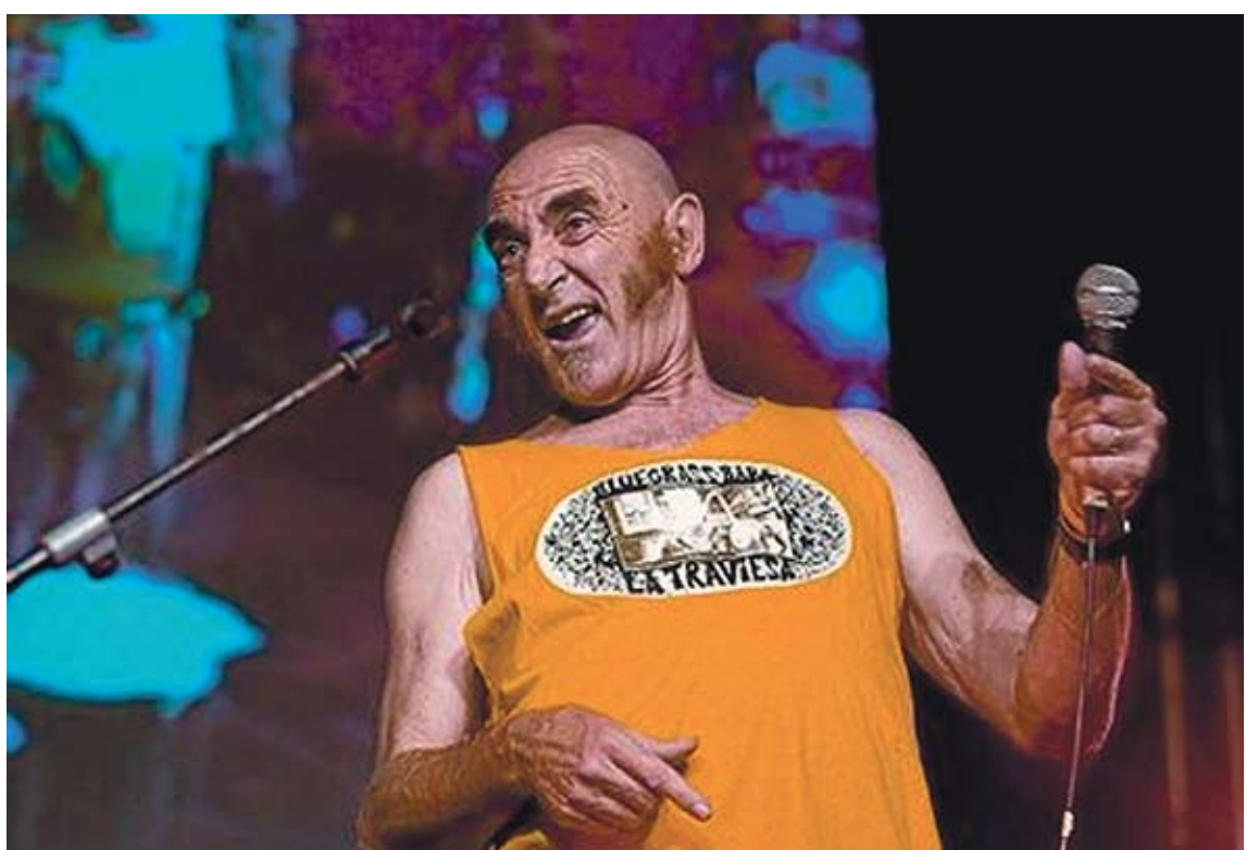
PAU RIBA. El músic mallorquí presenta el seu darrer espectacle a Roses aquest vespre

Tal com el mateix Riba diu: "Astre rei, lleó del gremi, Pau Riba es revisita perquè li ve de gust. Ribaibal, doncs. Tot és a punt. Torronets, crostons, i un pinzell que guixa l'aire. Tots hi sou convidats: s'admeten mames, nens i gripaus". ■