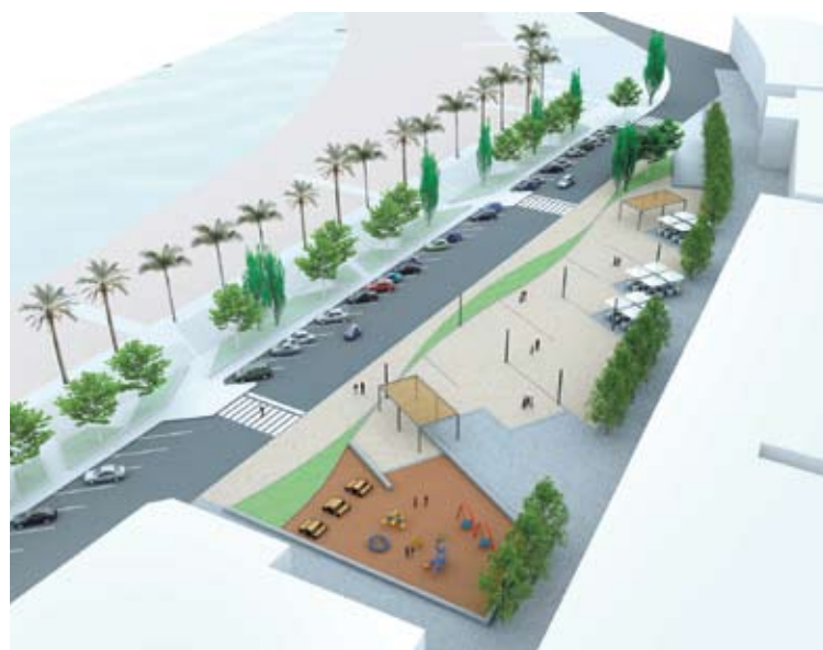
PLAÇA CATALUNYA. El possible escenari per a l'aparcament

L'aparcament soterrat tindria dues plantes i 219 places. S'establiria també un total de 545 places d'aparcament de zona blava en diferents punts del municipi. El pressupost total és de 5 milions d'euros. L'Ajuntament n'aportaria 1 milió i la resta aniria a càrrec de l'empresa adjudicatària. ■