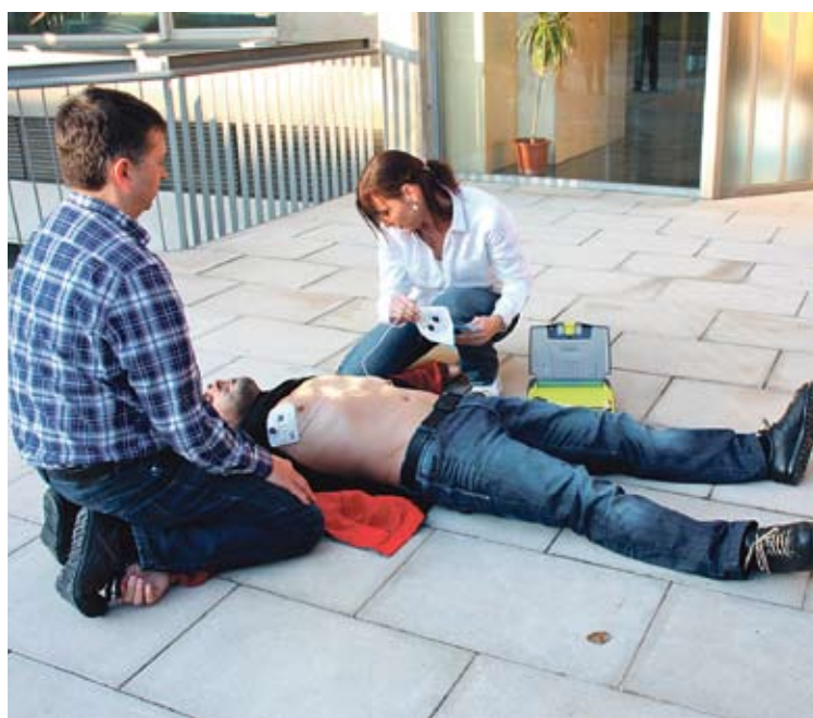
'IN SITU'. Els aparells permetran atendre les emergències molt més ràpid

■ L'Organisme de Salut Pública de la Diputació de Girona, Dipsalut, va presentar dimarts el model de desfibril·lador que implantarà arreu de la demarcació, i va donar tots els detalls del programa Girona, territori cardioprotigit (que convertirà la demarcació gironina en el territori cardioprotigit més gran d'Europa). Ho va fer durant una reunió informativa amb alcaldes i alcaldesses que es va celebrar al Parc Científic i Tecnològic de la UdG. I és que abans de l'estiu, l'entitat haurà cedit (gratuïtament) als municipis gironins un total de 650 desfibril·ladors. A l'Alt Empordà, tots els municipis en podran tenir com a mínim un de fix, i aquest nombre augmentarà en funció del nombre d'habitants, els equipaments