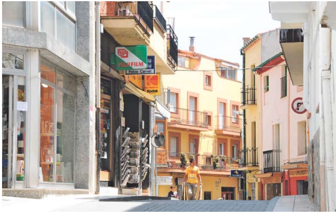
CENTRE DE LA VILA. El passat cap de setmana diversos comerços van estar sense gas i amb els baixos inundats

■ Les baixes temperatures que es van registrar el cap de setmana passat a diversos municipis de la comarca van afectar especialment els habitants d'un sector del centre de Llançà. I és que el fred va congelar una part de les instal·lacions per on circula el gas ciutat i el subministrament va estar interromput durant més de dos dies. Això va provocar dures crítiques dels veïns, que no tenien ni calefacció ni aigua calenta, i també dels comerciants i restauradors, que van tenir pèrdues importants. Arran d'aquesta situació, el Ministeri d'Indústria va obrir un expedient a la companyia (Energia, Serveis i Noves Tecnologies, SA) i dilluns va inspeccionar les instal·lacions. L'al-