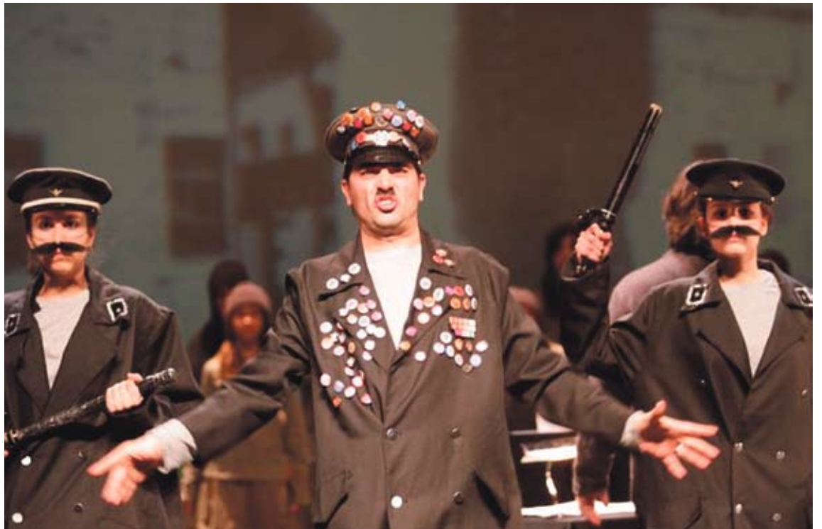
'BRUNDIBAR A THEREZIN'. Una imatge del muntatge que Quim Lecina presenta aquest dissabte a El Jardí

Al camp de presoners, entre el 1942 i el 1944, l'obra va ser representada pels reclusos als barracons fins a 55 vegades amb la intenció de transmetre una certa idea de normalitat entre els nens deportats. Els nazis van fer una filmació de l'espectacle per convertir-lo en una pel·lícula propagandística en què es mostrava als alemanys "el bé" que suposadament es vivia als seus camps de concentració. Poc després, Krása i tots els nens que participaven a l'òpera van ser assassinats al camp polac d'Auschwitz-Birkenau.