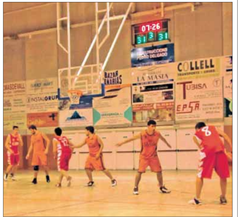
El sub-21 del Reale Bàsquet Vilafant va jugar a Banyoles. EMPORDÀ

Victòria del Júnior A de l'Adepaf, que va guanyar, a casa (63-56) al CB Sant Feliu. El Júnior B perdia, contra La Salle Reus (74-43), mentre que el Júnior B disputava un partit més igualat contra el CESET, que va acabar perdent a casa (48-51). El Mini femení va perdre (75-20) a la pista del Caldes.