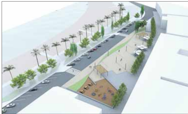
Projecte d'urbanització de la plaça Catalunya de Roses. EMPORDÀ

El pressupost total del projecte és de 5 milions d'euros, 4,8 dels quals destinats a la construcció de l'aparcament i urbanització de la plaça, i 198.000 per a l'establiment de les zones blaves. La inversió es finançarà per l'empresa adjudicatària, que pot comptar amb un milió d'euros aportat per l'Ajuntament. La concessió d'explotació tindrà una durada de 20 anys.