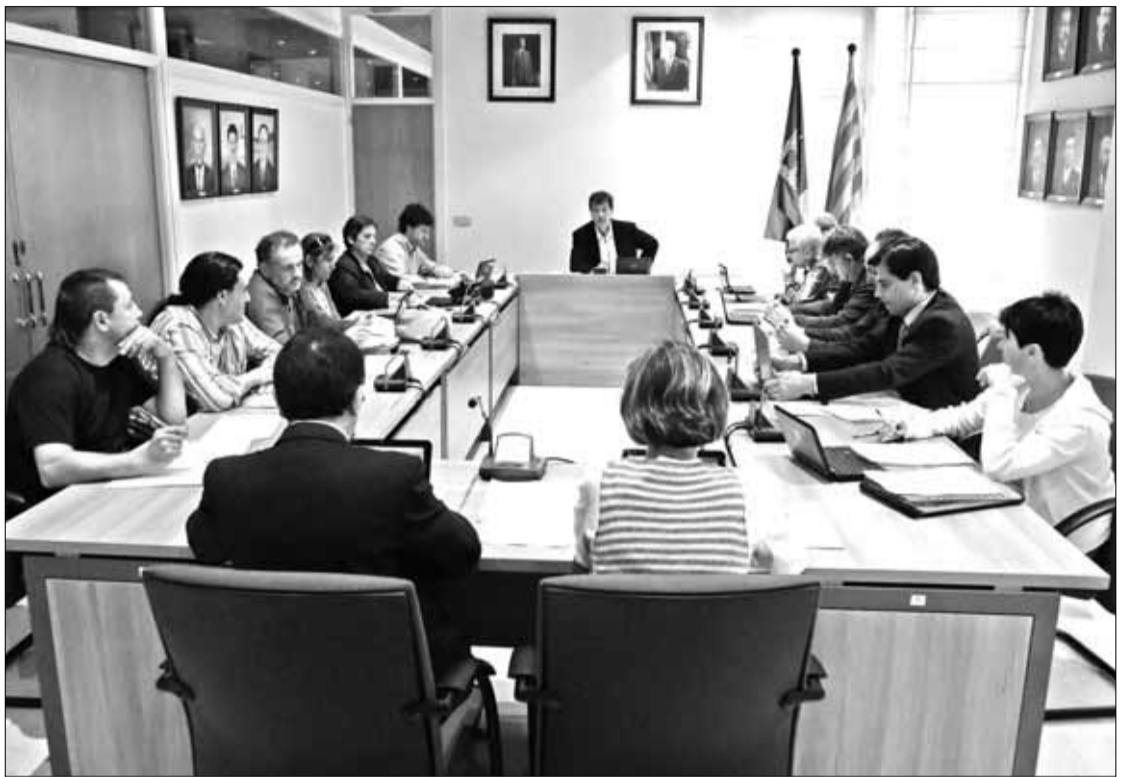
L'Ajuntament de l'Escala ja va adaptar la sala de plens per acollir disset regidors. EMPORDÀ