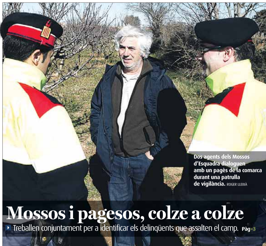
Dos agents dels Mossos d'Esquadra dialoguen amb un pagès de la comarca durant una patrulla de vigilància. ROGER LLEIXÀ

■ La planificació la redactaran tècnics del Servei Català de Trànsit. Pàg>4