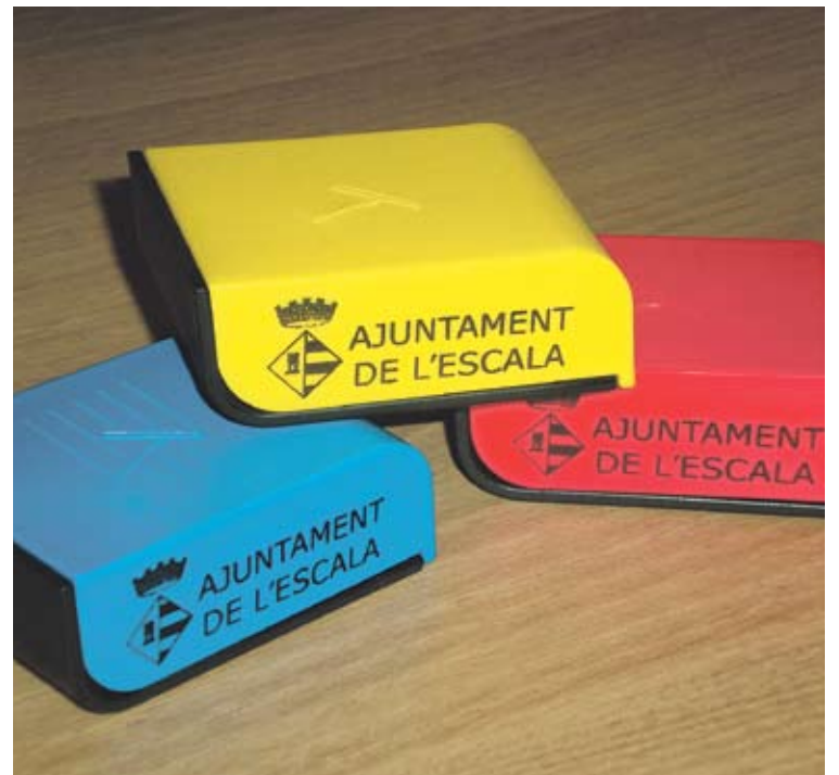
TRES COLORS. El cendrer fa set centímetres per quatre i dos d'alçada