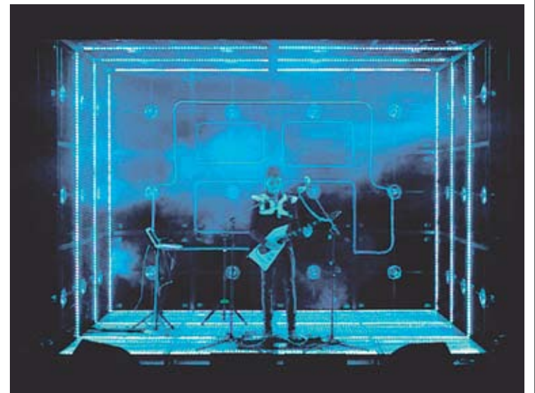
LA INSTAL·LACIÓ. Una imatge de l'espectacular muntatge