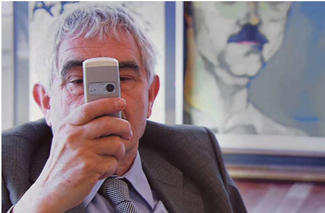
CLICK. Pasqual Maragall i el telèfon mòbil amb el qual ha fet les imatges de la mostra