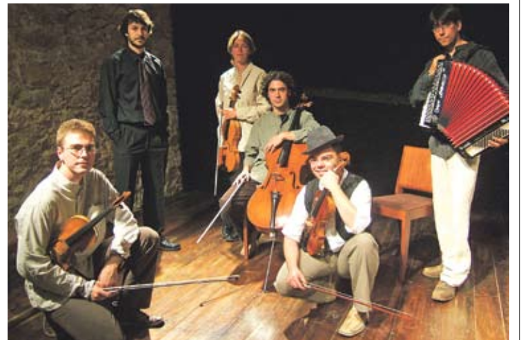
LA FORMACIÓ. El Brossa Quartet de Corda