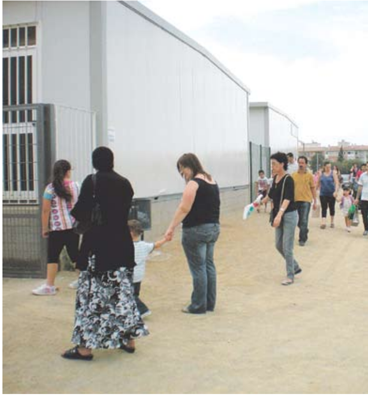
CEIP MONTSERRAT VAYREDA. El centre ha canviat de lloc dos cops