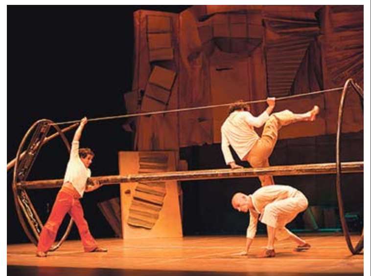
'PLECS'. Una instantània d'aquest espectacular muntatge