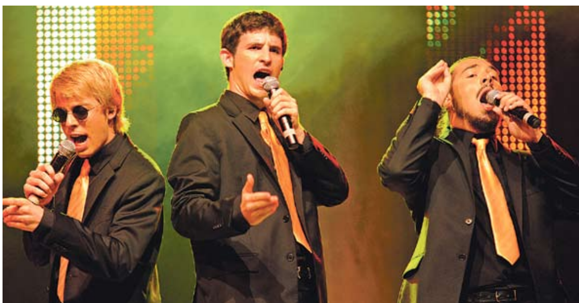
LA NOVA TRINCA. Música de Sau i La Trinca a parts iguals diumenge a la Casa de Cultura de Llançà