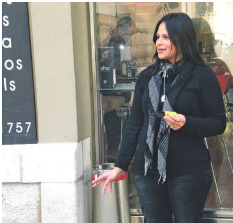
L'ECOCENDRER. La primera usuària de la campanya

■ Un mes després de l'entrada en vigor de les noves restriccions de la llei antitabac els municipis admeten que han de lluitar ara amb el problema de l'acumulació de burilles a la via pública. I és que les brigades de neteja han hagut d'intensificar força la feina. L'Escala ha decidit posar fre a aquesta brutícia i ja ha començat a repartir gratuïtament un miler de cendrers de butxaca. D'aquesta manera els fumadors que es con-