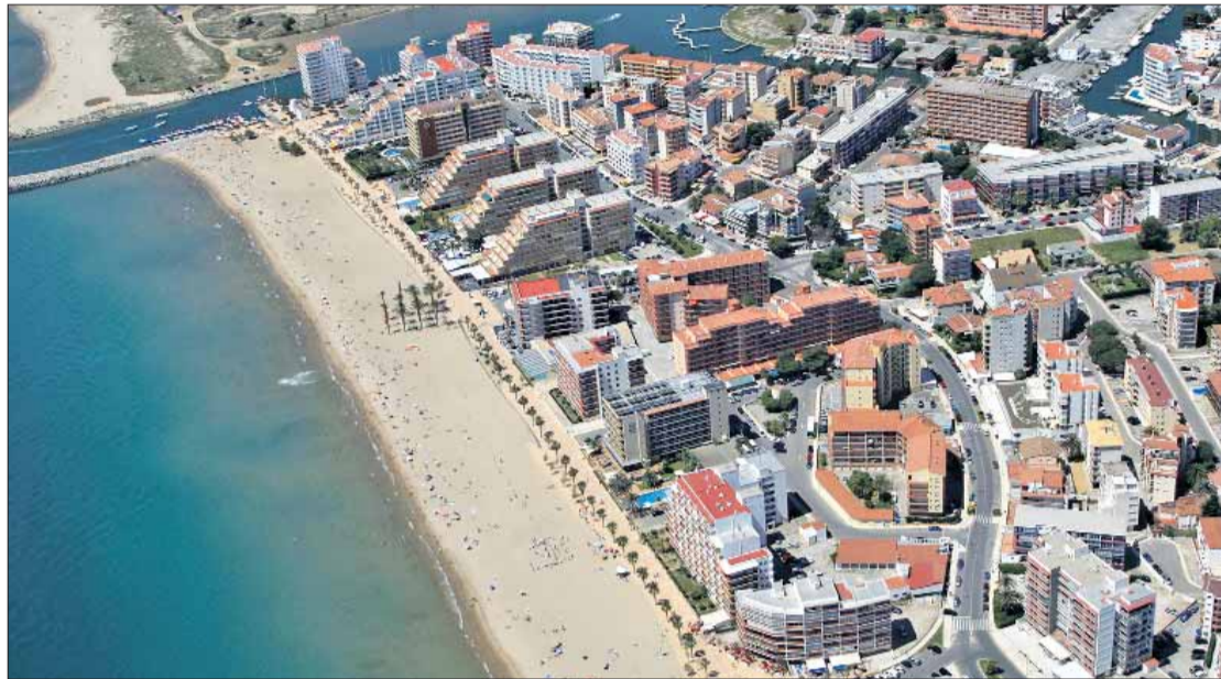
La Llei de costes considera que la Gola de l'Estany és dins de la zona maritimoterrestre. JORDI VELASCO

L'alcaldesa considera que la proposta de CiU sobre canviar la Llei de costes, que recentment ha estat presa en consideració pel Senat, per tal de solucionar l'atermenament, "no cal". Per Casamitjana, "el consistori ja hi ha treballat i està tot enfilat, a punt de resoldre". I afegeix que la proposició inclou el terme de "ciutat navegable, un concepte que no