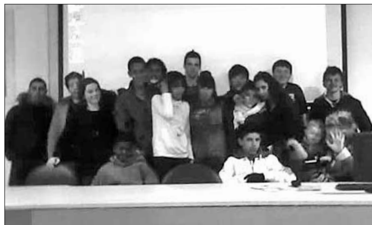
Els participants al curs de Roses. EMPORDÀ

Informació al 972 530 502 - 658 213 739 vittis_nd@hotmail.com