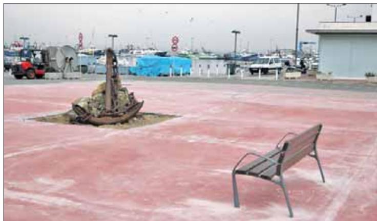
La rotonda s'ha construït on hi havia el restaurant El Moll. JORDI VELASCO