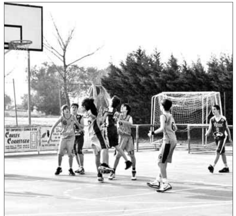
L'infantil masculí del Bàsquet Vilafant va vèncer a l'Adepaf.