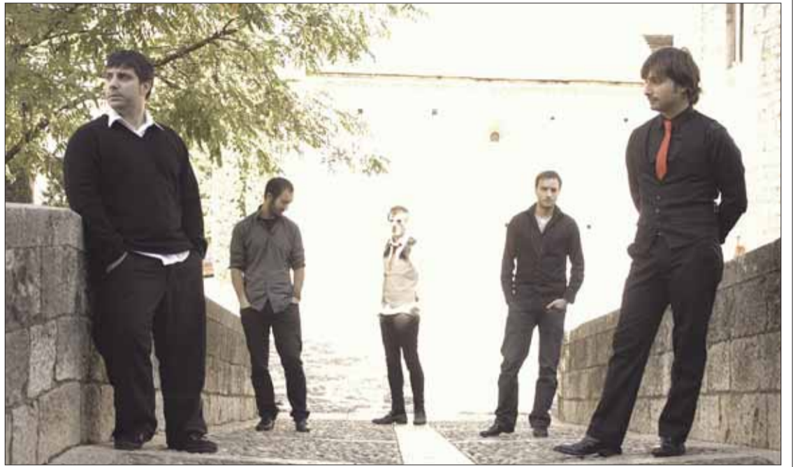
FOTOGRAFIA DE CESAREE

No és fàcil editar un disc en els temps que corren. Per aquest motiu, Cesaree han optat per l'autoedició. Ha estat un esforç important "però volíem fer una cosa seriosa, no només anar tocant". Els cinc components del grup