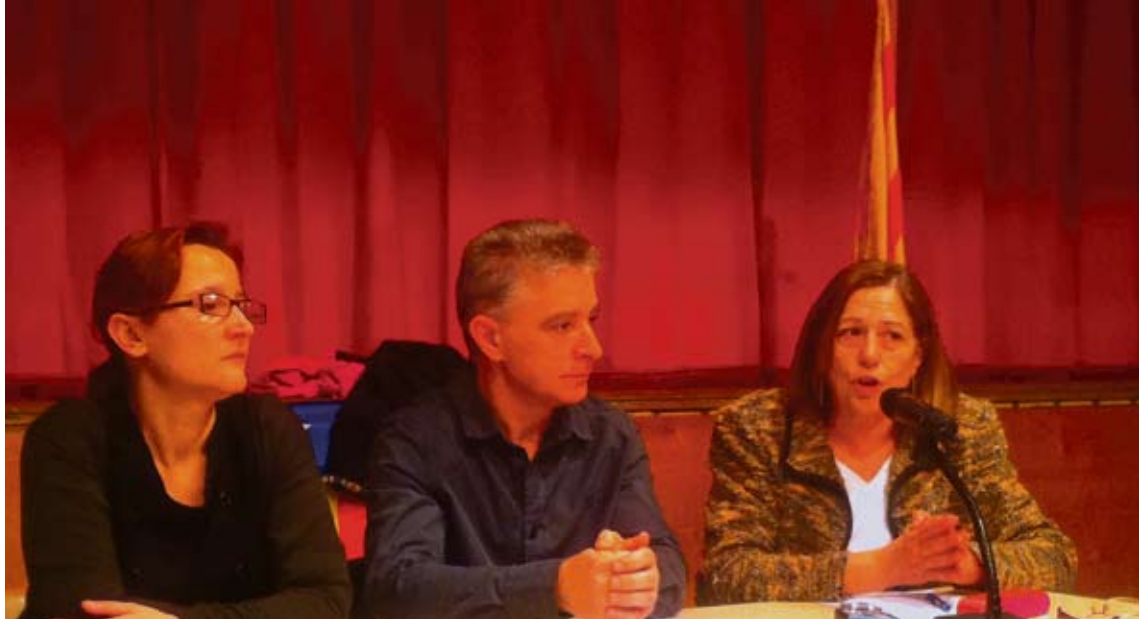
PRESENTACIÓ. L'acte es va celebrar diumenge al Centre Esportiu i Recreatiu