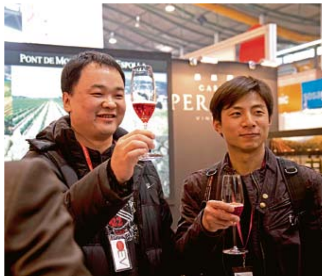
EL FÒRUM. Algunes instantànies preses ahir dilluns a la trobada gastronòmica gironina. A baix, a l'esquerra, l'estand del celler Vinyes dels Aspres