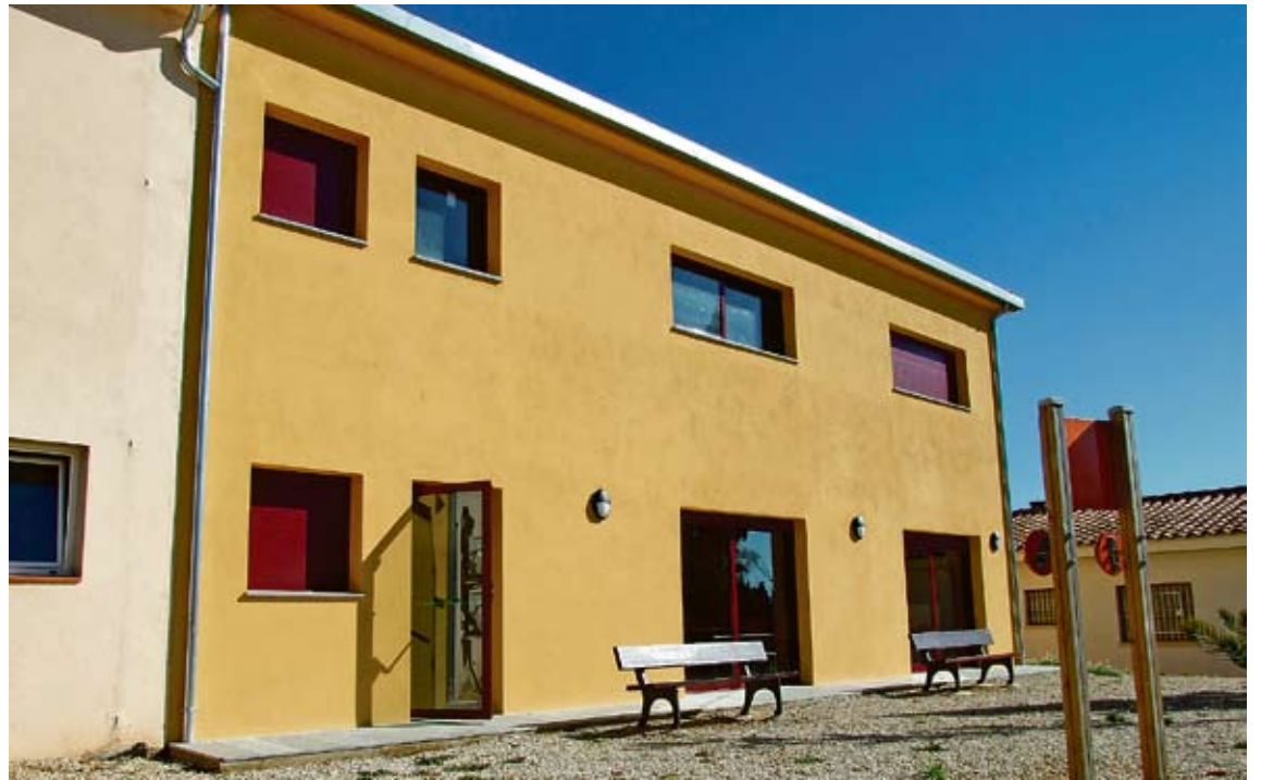
L'EDIFICI. És de nova construcció, està ubicat al costat del dispensari i el pis de dalt s'ha reservat per a una futura ampliació G. ARCHÉ

L'edifici, que està ubicat just al costat del dispensari (per poder-ne aprofitar els recursos mèdics), ja fa dos anys que està construït. Fins al passat mes de novembre, però, l'administració local no va poder signar el conveni amb la Generalitat per equipar la planta baixa, que és la que per ara es destinarà al centre de serveis. El