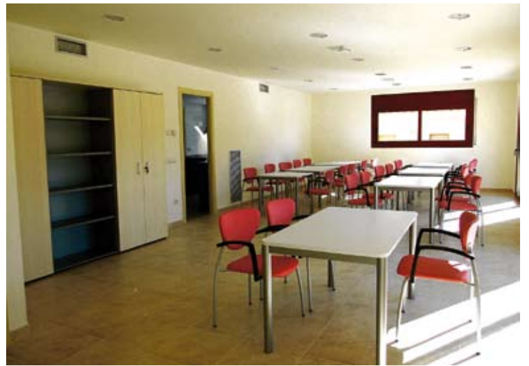
INTERIOR. De moment el servei de menjador és el que té més tirada G. ARCHÉ

pis de dalt, que també està enllestit, es reserva per a una possible ampliació futura. Actualment l'Ajuntament està donant a conèixer el nou equipament entre els veïns per captar els futurs usuaris. De moment, explica Ventalló, hi ha molts interessats a utilitzar el servei de menjador. La previsió és poder inaugurar el centre quan hi hagi 15 o 16 persones inscrites, previsiblement al mes de març (o, a molt estirar, a l'abril). Tal com ha explicat l'alcalde de Camallera, l'objectiu és que més enllà de la vessant assistencial, el centre pugui esdevenir una plataforma de serveis per a la gent gran. ■