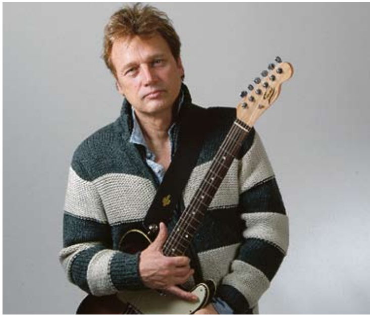
DAVID KNOPFLER. El músic escocès en una imatge de l'actual gira