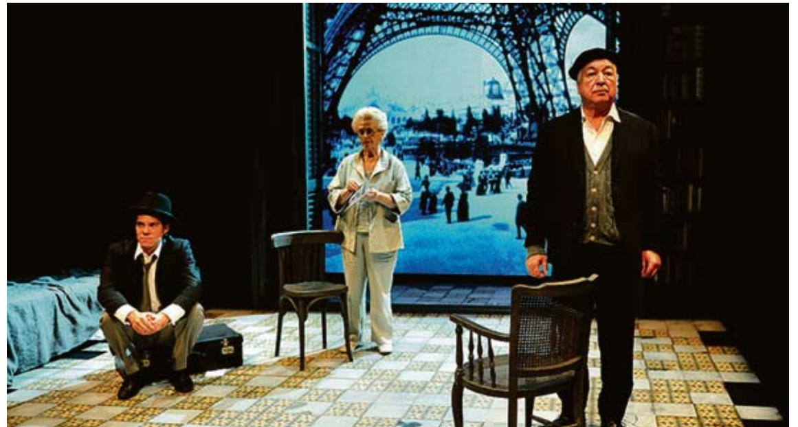
'EL QUADERN GRIS'. Una imatge del muntatge que dirigeix Joan Ollé