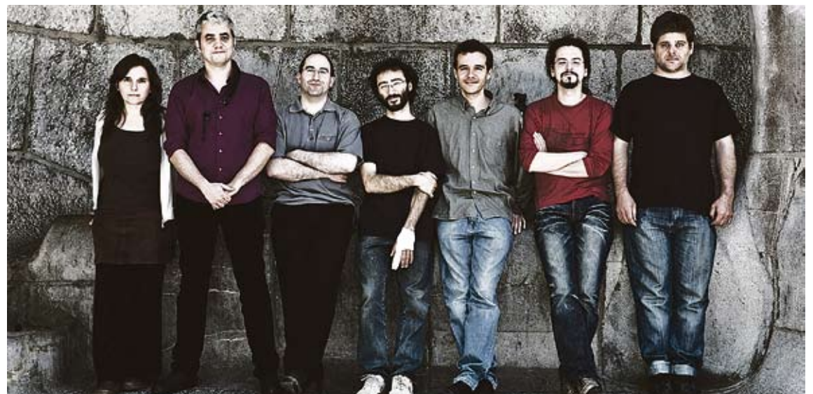
TARANNÀ. La formació barcelonina encapçala aquest projecte de música experimental