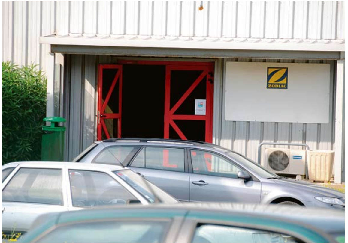
NAU DE ZODIAC. La fàbrica és a la zona industrial de la carretera de Vilajuïga

la petició de Zodiac com una bona notícia perquè "vol dir que la zona industrial ja és efectiva" però lamenta que en època de crisi s'hagi d'abonar aquesta quantitat. "Per nosaltres això és una patata calenta més de l'anterior govern municipal", diu l'actual alcaldessa, que afegeix que "és una llàstima que s'hagin de destinar aquests diners, 100 milions de les antigues pessetes, quan en temps de crisi aquests euros ens anirien bé per a equipaments al municipi". L'Ajuntament també recorda a l'empresa l'esforç perquè Zodiac no marxi, tot i que "actualment no hi ha cap rosinc treballant-hi". Als més de 800.000 euros s'hi han