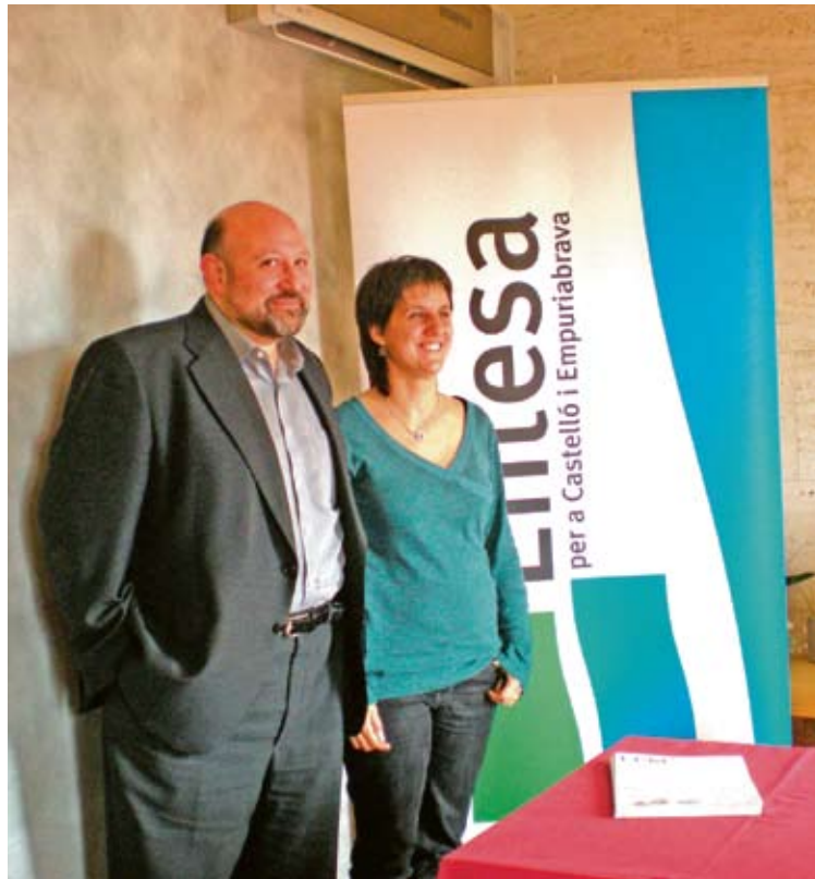
TRASPÀS DE PODERS. Ahir van presentar el nou projecte, de caire continuista G. ARCHÉ

Durant la presentació del nou projecte, que tindrà un caire continuista, tant Iglesias com Escutia es van mostrar molt satisfets de la tasca realitzada dins de l'equip de govern en aquests quatre anys, i van destacar tots els projectes impulsats des de les regidories d'Urbanisme, Serveis i Promoció Econòmica -adjudicada a Iglesias- i Sostenibilitat i Participació -d'Escutia-. "Hem passat temps difícils que ens han ajudat a créixer, però també a replantejar quina havia de ser la nova candidatura", va dir Escutia, que es va mos-