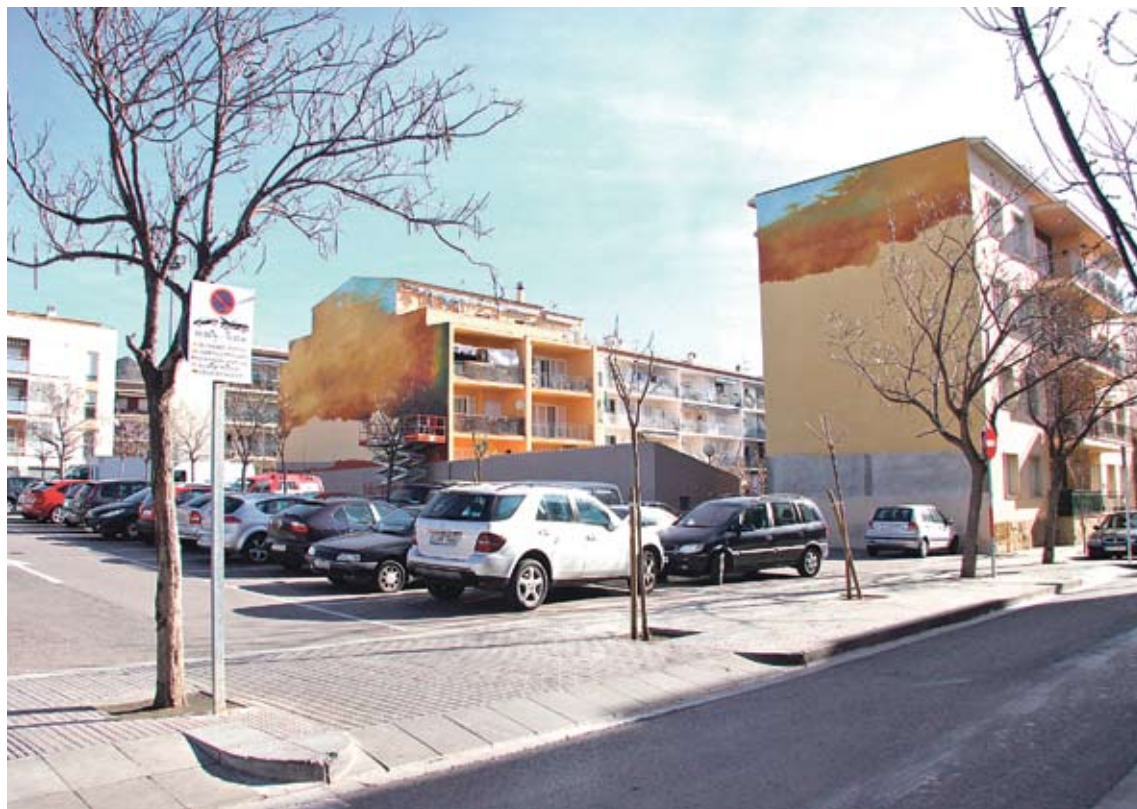
COLORI!. Dues imatges dels edificis sotmesos a transformació

a treballar. El material que utilitza és pintura plàstica d'intempèrie per garantir-ne la durabilitat, i la durada prevista per a la finalització del projecte és de dos mesos. El pressupost, segons informa l'Ajuntament de Roses, és de 19.000 euros.