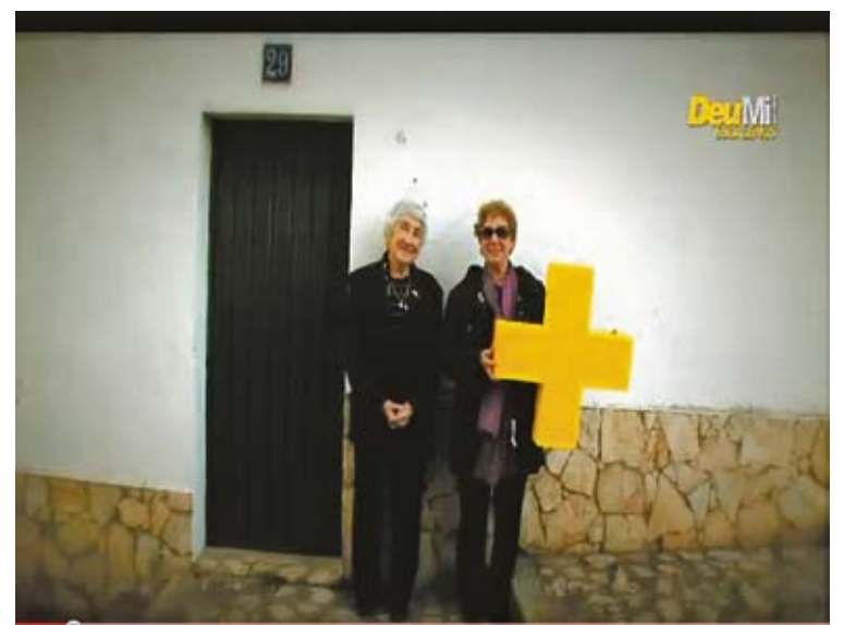
VIDEO. El símbol positiu identifica la suma d'habitants de l'Escala

■ L'àrea de Turisme de l'Ajuntament de l'Escala està en la darrera fase del procés de reconeixement de les oficines de Turisme amb la Q de qualitat turística, un aval de garantia dels processos interns, del tracte amb els usuaris i de la informació i promoció del municipi, que atorga el Institut para la Calidad Turística Española. Aquesta va ser una de les qüestions que es van tractar dimecres en la reunió de l'Agència de Desenvolupament Econòmic i Turístic de l'Escala, que agrupa iniciativa pública i privada. Actualment, només l'Estartit i Lloret tenen la Q de qualitat per a les oficines de Turisme, i l'Escala seria la primera de l'Alt Empordà a obtenir-la.