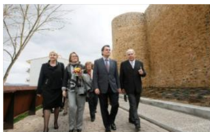
L'alcalde de Llagostera, Fermí Santamaria, i el president de la Generalitat, Artur Mas, aniol rescosal