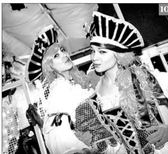
FOTOGRAFIES DE ROGER LLEIXÀ