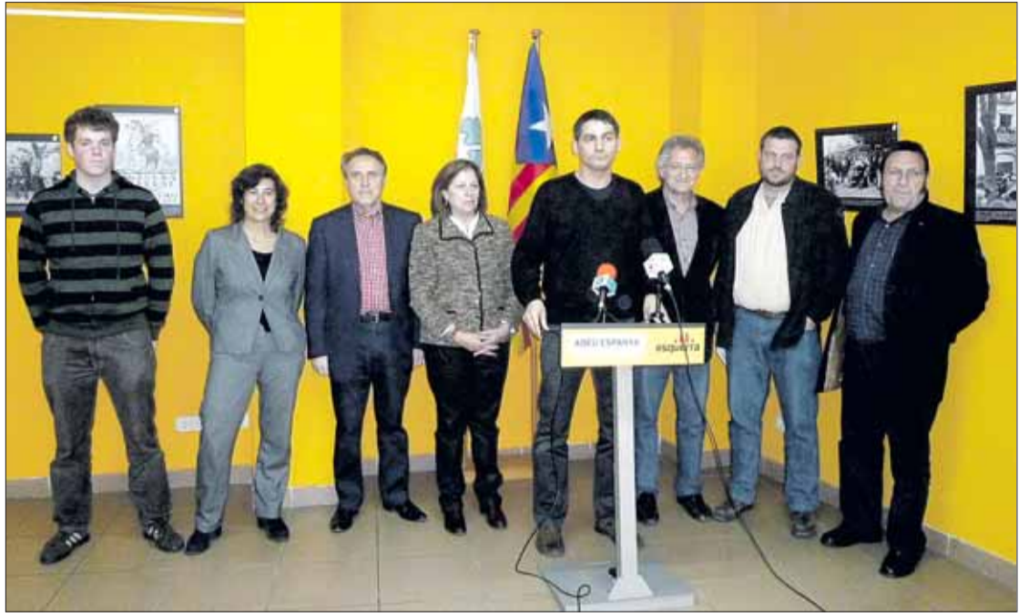
La formació republicana va convocar aquest dilluns una roda de premsa sobre municipals.