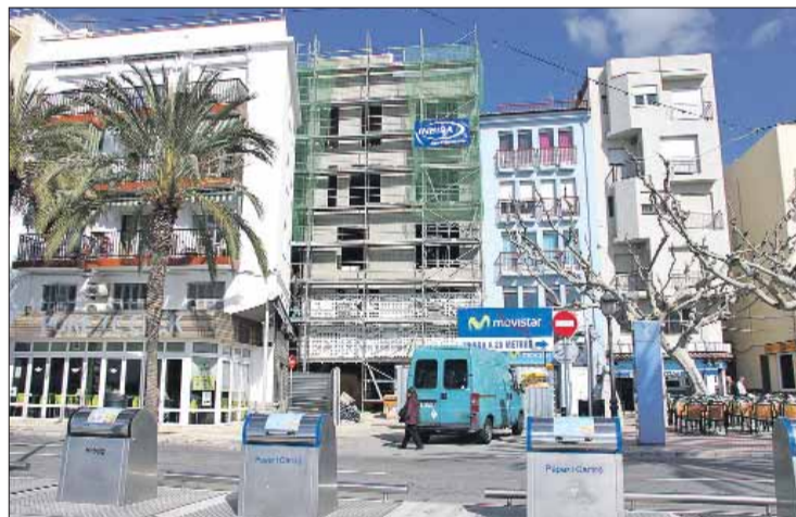
El futur equipament sociocultural és a la plaça Sant Pere.