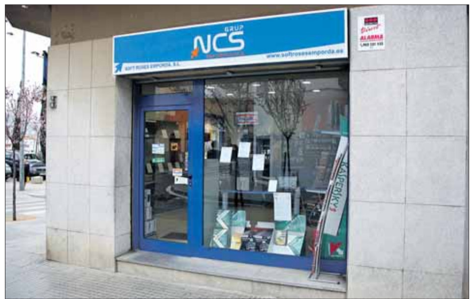
Els establiments del grup NCS Informàtica estan situats al carrer Sant Pau, 82 de Figueres, i al carrer Doctor Barraquer, 14 de Roses.