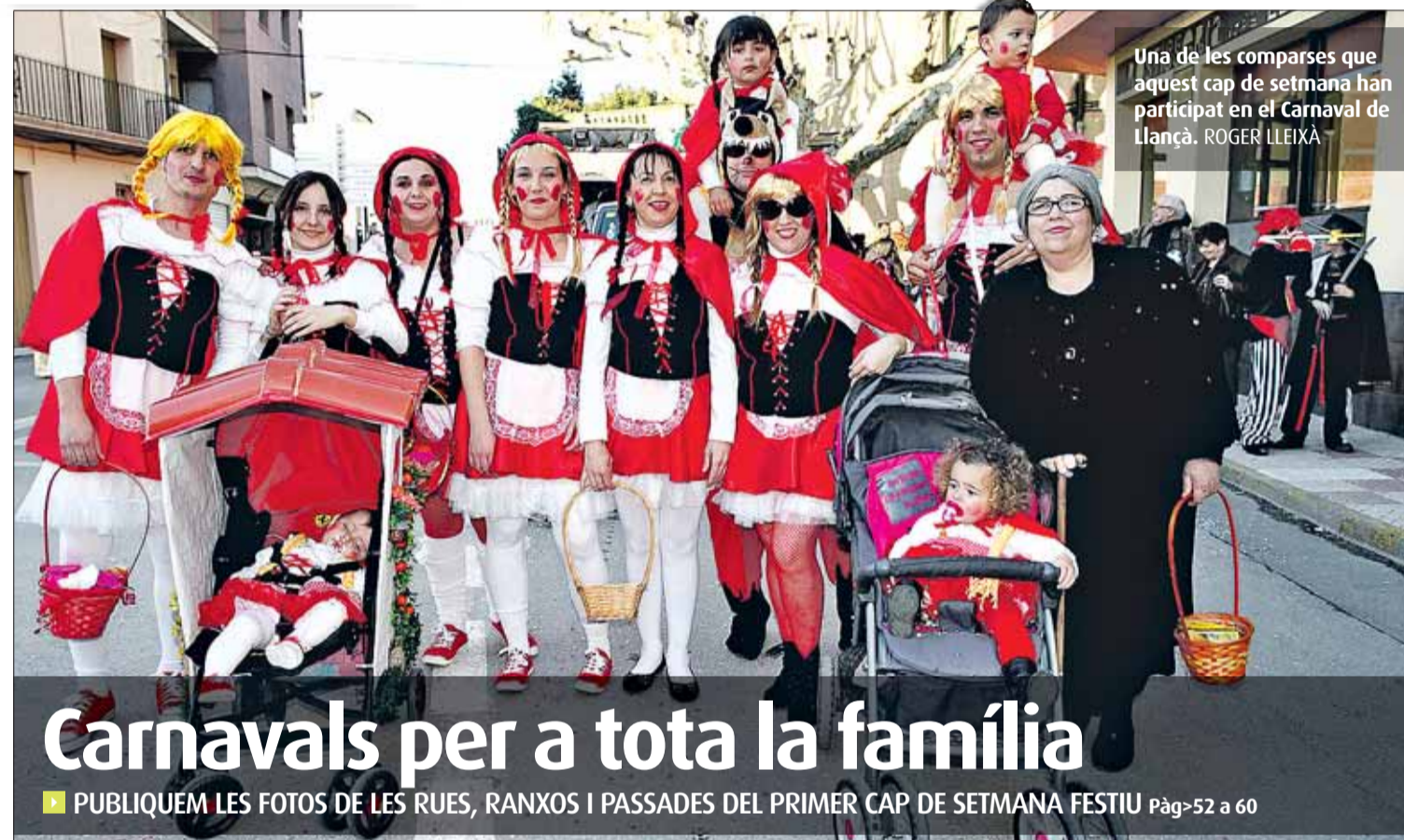
Una de les comparses que aquest cap de setmana han participat en el Carnaval de Llançà. ROGER LLEIXA