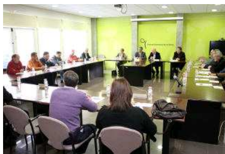
La reunió que van mantenir alcaldes i el delegat del Govern al Consell.