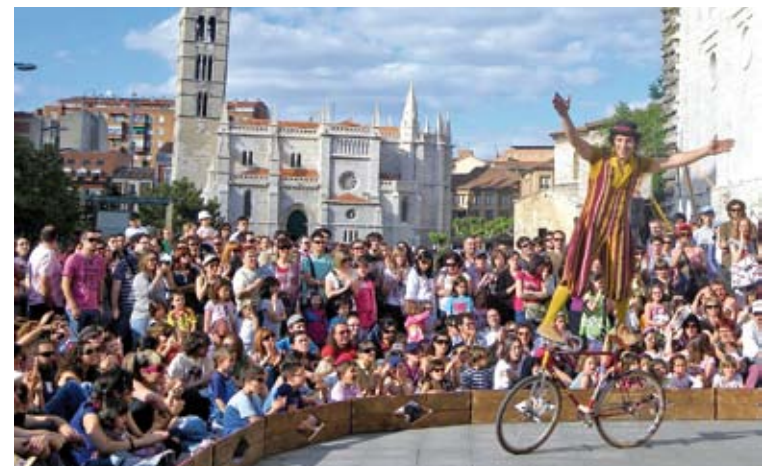
LA MÀGIA DEL CIRC. Cíclicus actuarà diumenge a les 18 h

Sota la direcció de Busquets i Cazorla, Mendoza i Haupt encarnen dos germans que es retroben a l'indret més entranyable de la seva infantesa i del qual conser-