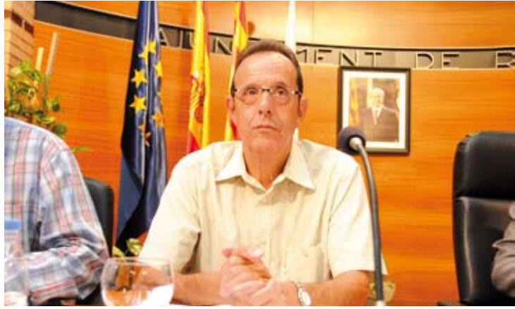
DONAT. Ha ocupat la regidoria d'Urbanisme aquesta legislatura