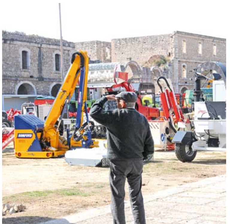
PATI D'ARMES. Ahir a la tarda es feien els darrers preparatius de la fira