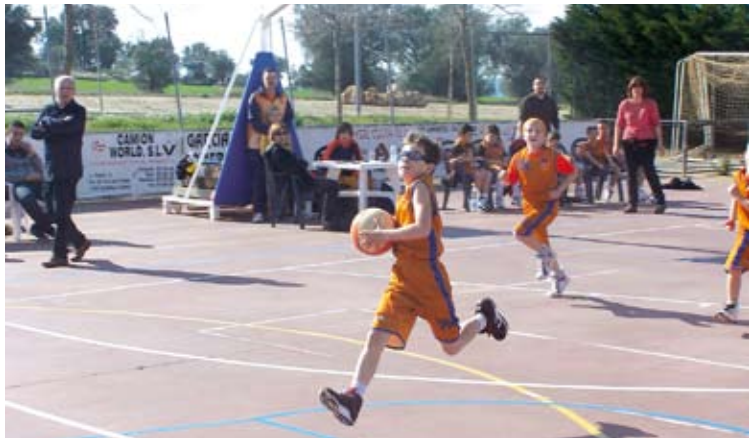
DUES CARES. El premini mixt va oferir més bona imatge a la segona part HORA NOVA