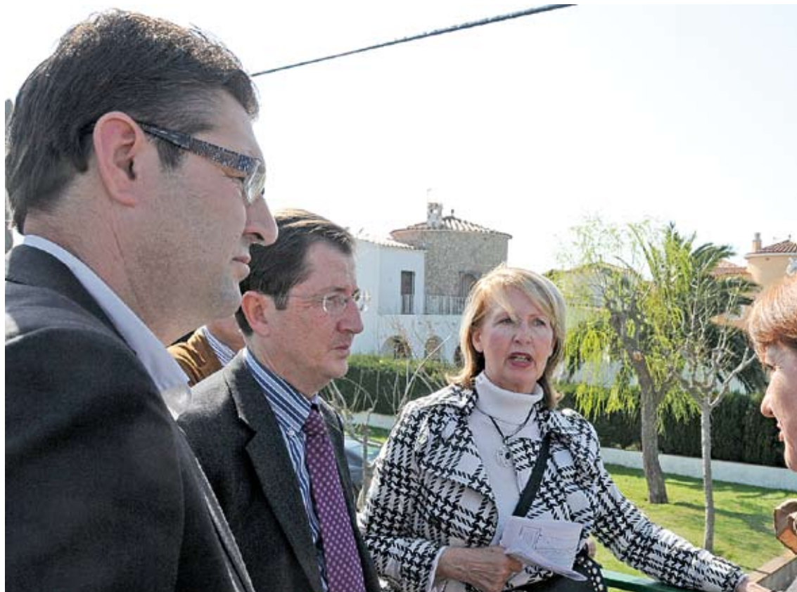
EMPURIABRAVA. El subdirector general de Gestió del domini públic visitant la zona dels canals