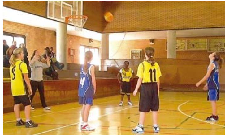
INTRACTABLES. El mini femení de l'Esplais va sumar una nova victòria HORA NOVA