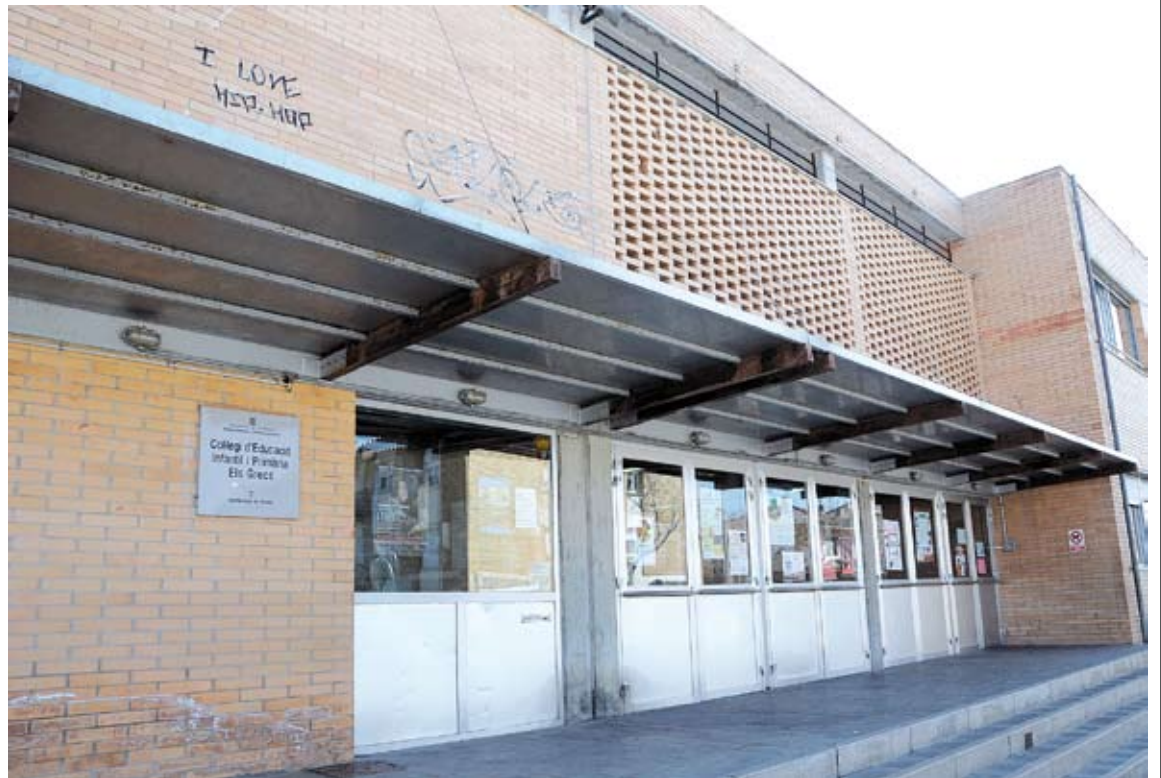
ELS GRECS. El CEIP ha patit diverses accions de vandalisme i robatoris

EL COST del circuit de videovigilància a Els Grecs no supera els 7.000 euros i, segons el regidor de Territori, el sistema "no és car per les facilitats que representa. El control es pot fer perfectament des de qualsevol punt gràcies a les noves tecnologies i evita molts desplaçaments". És per