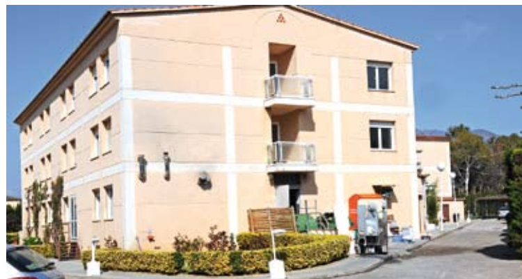
TORNANT A LA NORMALITAT. Els fets van passar la nit de dilluns