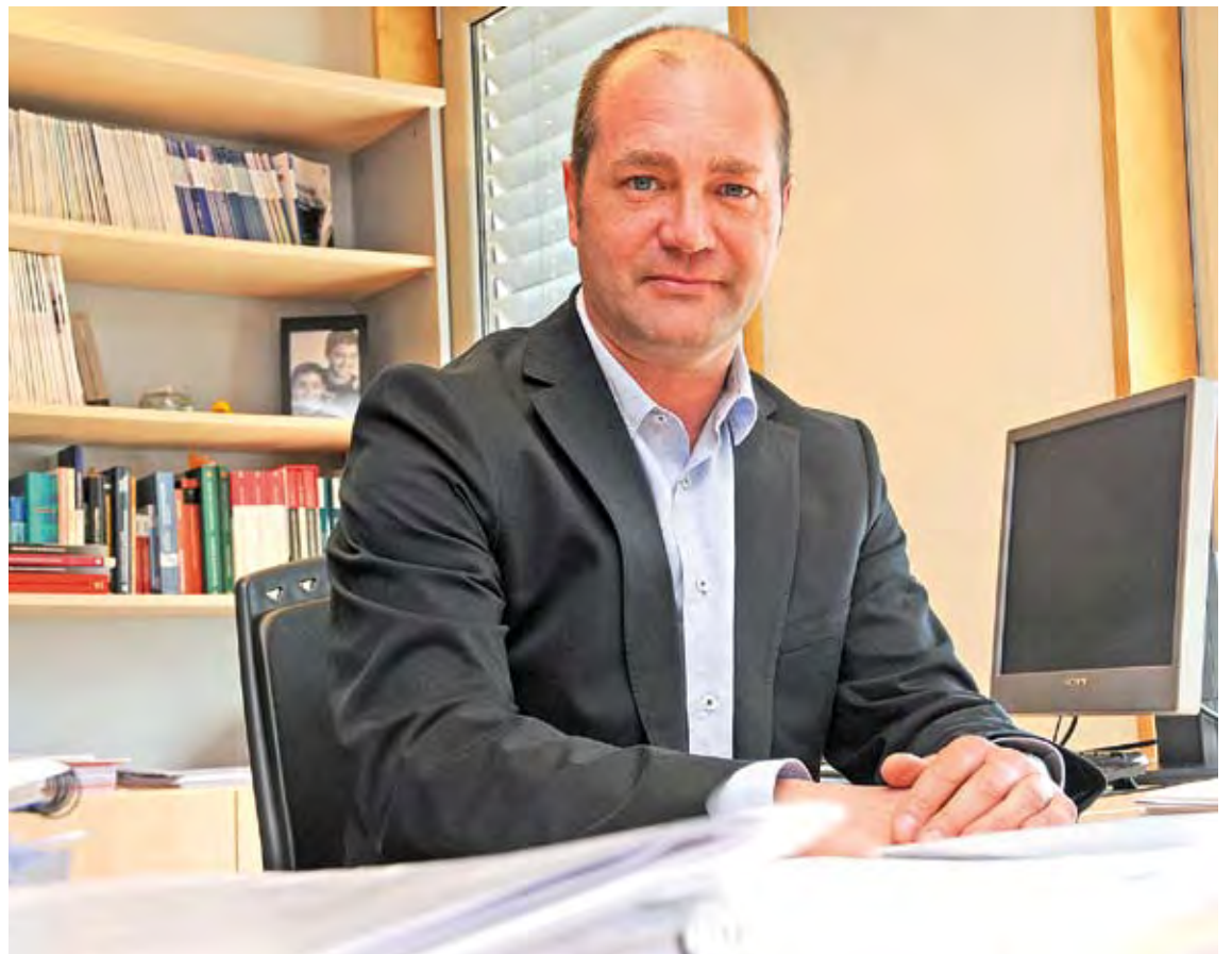
EXPERIÈNCIA. Ruiz ha estat sempre vinculat al finançament municipal. Ara a Roses, però també a Figueres

No es pot verificar, perquè tenen una despesa per càpita semblant a la resta; d'ingressos, més o menys tenen el mateix per habitant; de dèficit pressupostari, no