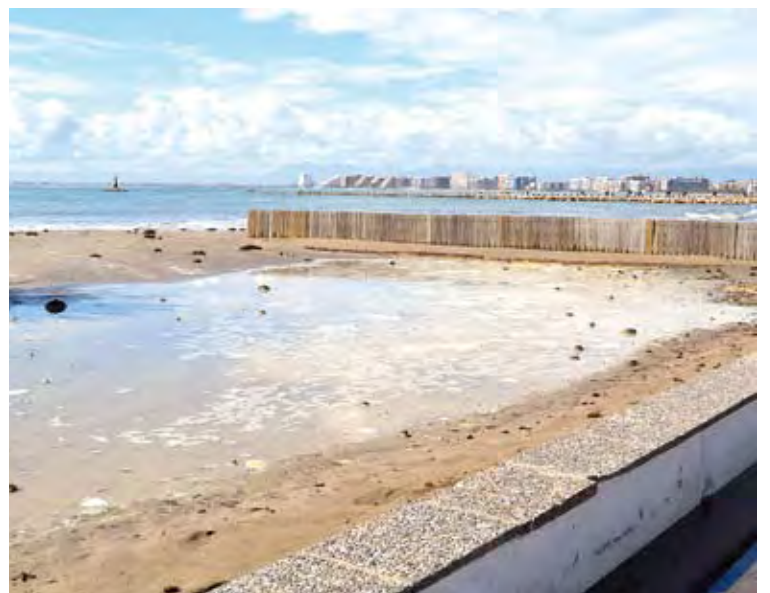
REGRESSIÓ. Les llevantades causen estralls a la zona de la Punta

■ L'Ajuntament de Roses ja ha fet públic el concurs d'idees per la urbanització de l'últim tram del passeig marítim. Tal com havia avançat HORA NOVA les propostes han d'incloure una solució per a la platja de la Punta. Els projectes es poden presentar fins al 3 de maig i estan dotats amb premis d'entre 3.000 i 20.000 euros. ■