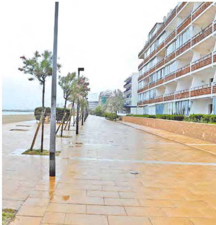
GOLA DE L'ESTANY. La zona que tornarà a ser sòl privat

El portaveu dels propietaris ha volgut recordar que en casos com el de la Gola de l'Estany el desbloqueig no es pot fer efectiu si no s'han fet totes les passes: aprovació del document, exposició pública, al·legacions i publicació oficial. Sobre els altres casos de Santa Margarida que no tenen res a