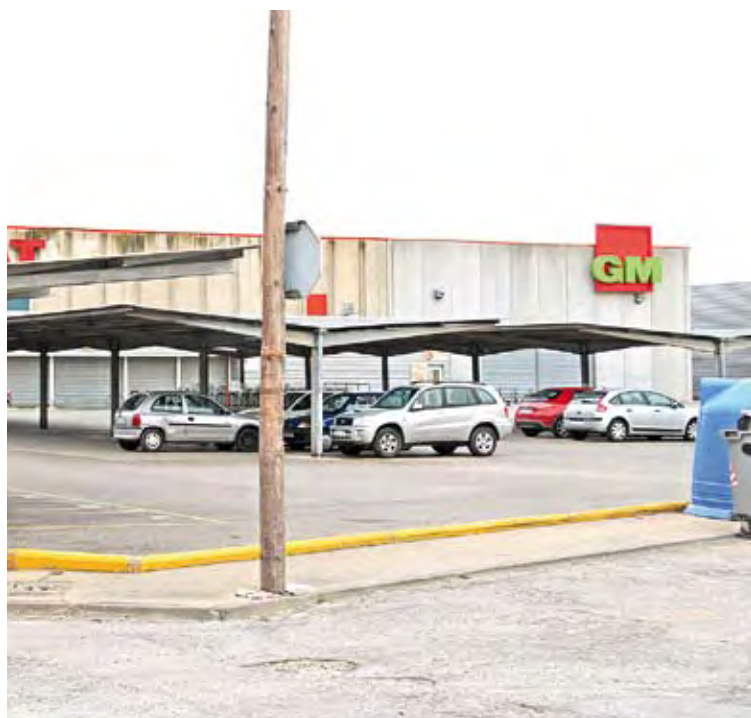
GROS MERCAT. El nou establiment donarà feina a 16 persones

El nou establiment substitueix l'actual Gros Mercat que va obrir les portes el 1995. Dels 16 llocs de feina, 9 són de nova creació. Els clients del nou establiment de Vitòria-Gasteiz tindran a la seva disposició una zona de producte fresc de 525 m 2 , així com una sala de productes de gran consum de 2.435 m 2 amb alimentació en