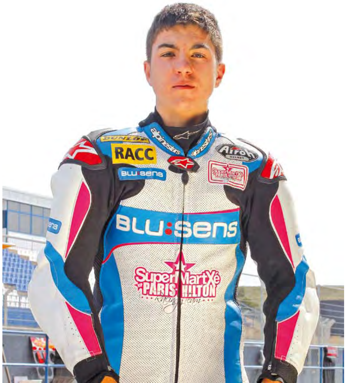
REPTE. Maverick Viñales fotografiat al circuit de Jerez en el segon test oficial de pretemporada

El balanç és positiu perquè he estat rodant bastant bé en tots els entrenaments de la pretemporada, però això té una importància relativa. Serà en cursa a on es veurà la gran quantitat de pilots ràpids del Mundial i la qualitat que tenen. Sens dubte qualsevol d'ells serà un rival a batre.