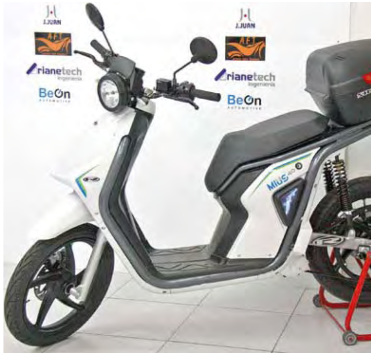
LA MOTO. Inicialment, va destinada a empreses amb grans flotes de motoristes