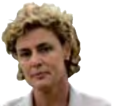
Magda Casamitjana Alcaldessa de Roses

No pretenem estudiar el fenomen turístic, abastament tractat, però sí reflexionar sobre els canvis que va suposar el turisme de masses des de l'actual escenari de canvi de model turístic que té la qualitat, la cultura i la natura com a valor afegit. En resum, reflexionar sobre el nostre passat per construir sòlidament el nostre futur. ■