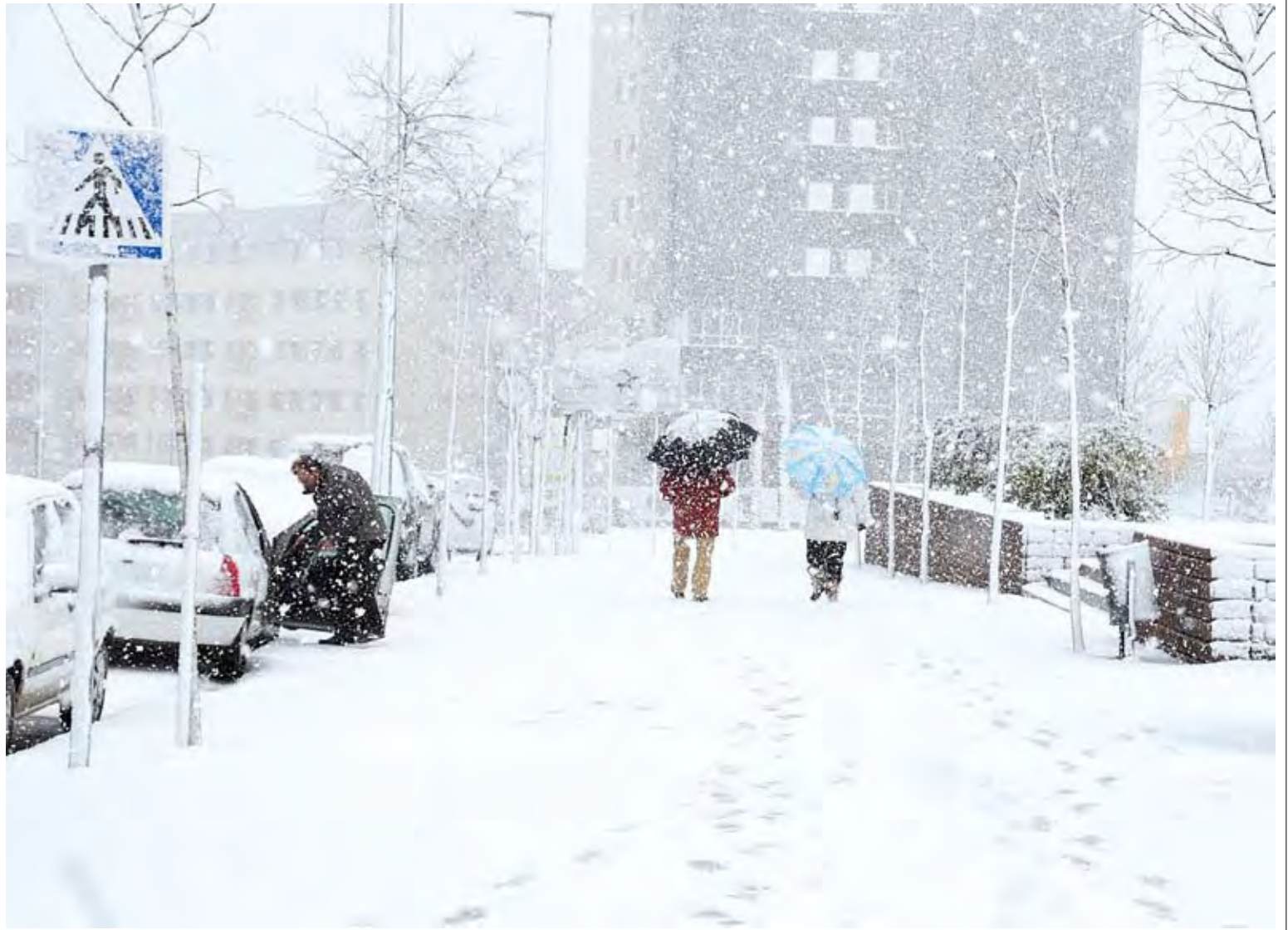
LES NEVADES. Els talls de subministrament elèctric produïts a partir del 8 de març van suposar un munt de consultes i queixes dels consumidors empordanesos