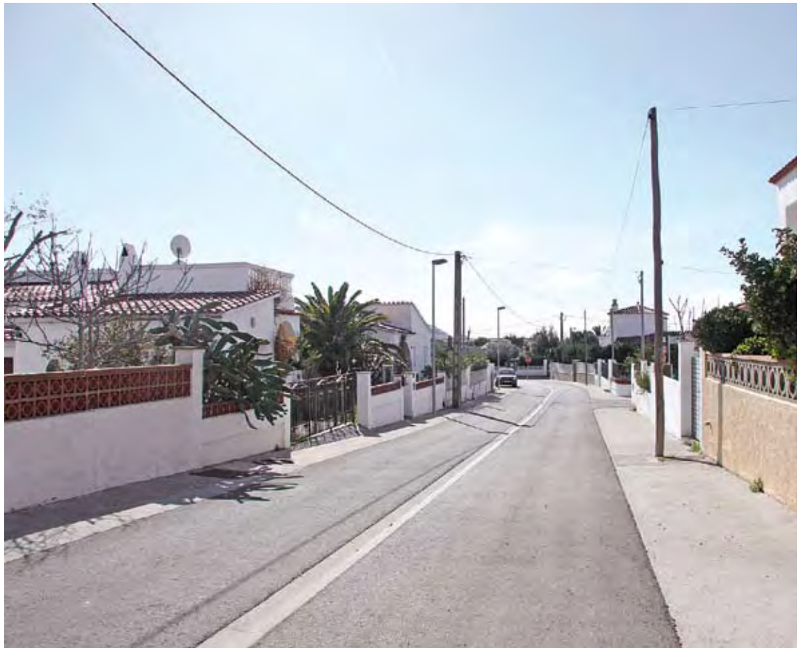
MAS BOSCÀ. Les obres d'urbanització van acabar a finals del 2009

El projecte del Mas Boscà ha suposat la urbanització de més de 30.000 m 2 de carrers, que ha inclòs tant la pavimentació de calçades i voreres com la renovació de les xarxes de serveis. Els treballs van acabar a finals del 2009. Abans de començar les obres els veïns van prendre la difícil decisió de tirar endavant amb l'augment del pressupost. Es va considerar que era la millor opció per no deixar inacabat el projecte. ■