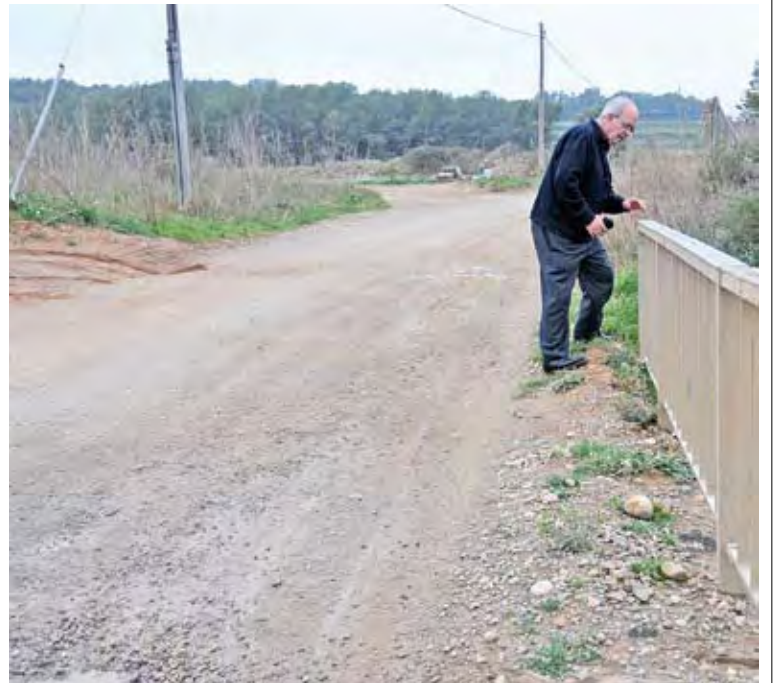
SENSE CAPA D'ASFALT. L'alcalde de Pontós sobre el terreny

D'altra banda, i pel que fa a les obres de l'alta velocitat entre Girona i Figueres, els treballs més avançats són a l'Alt Empordà. Segons Adif el material per fer les vies ja s'està estenent per la zona de l'obra. En qüestió de xifres, entre Sant Julià de Ramis i Figueres s'hauran col·locar 131 quilòmetres de carrils. Això representen 115.820 travesses i 205.650 m 3 de balast, que és el material de grava grossa que permet l'assentament de les travesses. Els treballs de les