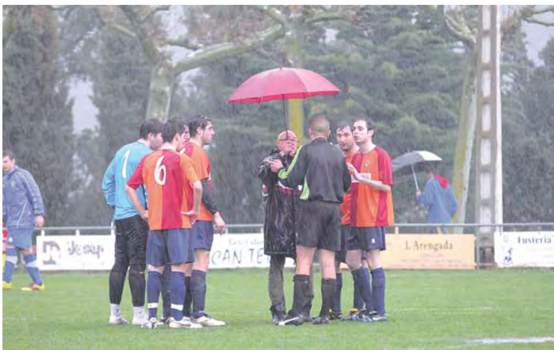
IMPOSSIBLE. Els jugadors del Sant Miquel conversen amb l'àrbitre del partit que havien de jugar a Agullana