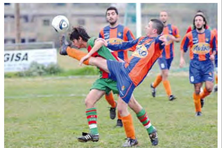
LÍDER SÒLID. El Roses disposa de nou punts de marge sobre l'Esplais