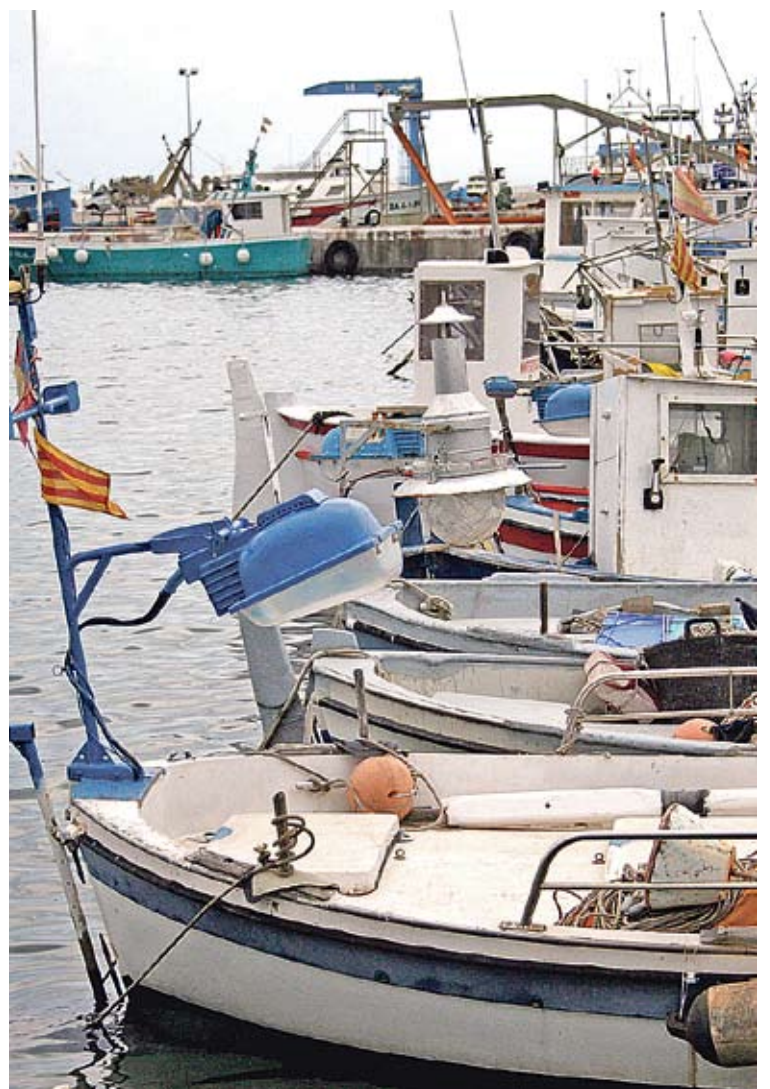
A PORT. L'activitat d'arrossegament s'ha aturat un mes a la comarca

L'aturada de l'activitat de la flota d'arrossegament ha estat de dos mesos i s'ha fet principalment per la regeneració d'espècies com ara la gamba. Durant el mes de gener van estar ancorades les embarcacions del Port de Palamós i al febrer els va tocar el torn a les flotes del Port de la Selva, Llançà, Roses, l'Escala i Blanes. Les aturades a les comarques gironines es van fer de manera alternada per "no desatendre els clients". ■