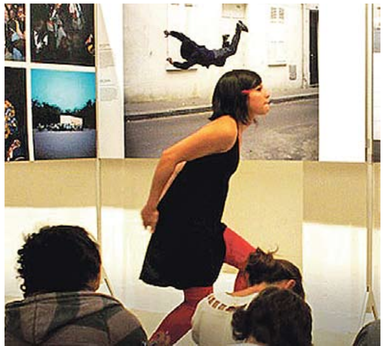
VISA POUR L'IMAGE. El certamen es podrà veure a Figueres

I un quart punt és la possibilitat que una part del certamen Visa pour l'Image pugui recaure ja aquest 2011 a Figueres. Aquest punt es tancarà, possiblement, el proper 29 d'abril quan una delegació francesa visiti Figueres per veure i analitzar sobre el terreny