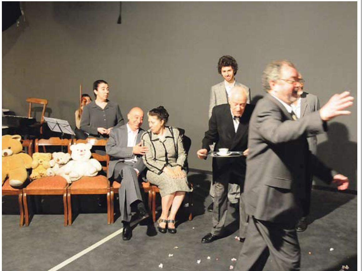
ASSAIG GENERAL. 'El jardí dels cirerers' està format per una vintena de personatges

La direcció d'aquesta obra ha anat a càrrec de Josep Maria Cortada, que n'ha ressaltat la complexitat per dos motius. El primer, pel fet que hi ha una vintena de personatges en escena, més un grup de músics que toquen en directe. El segon, per la història que s'explica -l'obra va ser escrita el 1904 i reflecteix una societat canviant, que pateix una crisi de valors- i per la naturalesa dels personatges -és més important el que callen que el diuen-. Entre l'elenc hi ha actors històrics de La Funcional i, també, noves incorporacions. ■