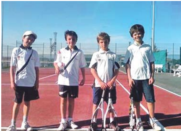
SENSE SORT. Els alevins del CT Figueres van caure derrotats