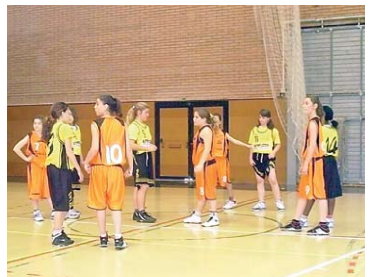
PRIMERA DERROTA. Una imatge del partit entre el Castelló i l'Esplais