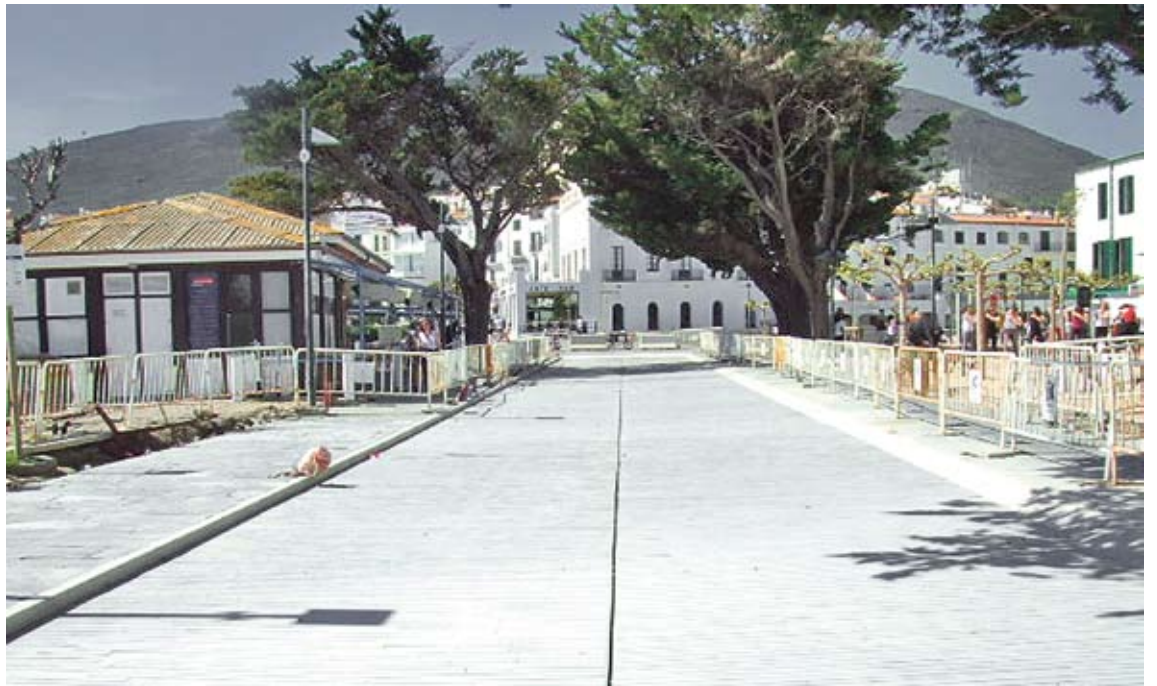
BON RITME. Fa una setmana s'amuntegava el material a la zona i ara el paviment ja està col·locat

L'alcalde havia demanat fa uns dies a l'empresa constructora més efectius i més hores perquè l'obra estigués enllestida abans de la Setmana Santa