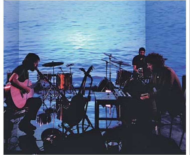
STANDSTILL. La banda barcelonina i l'escenografia que presenten