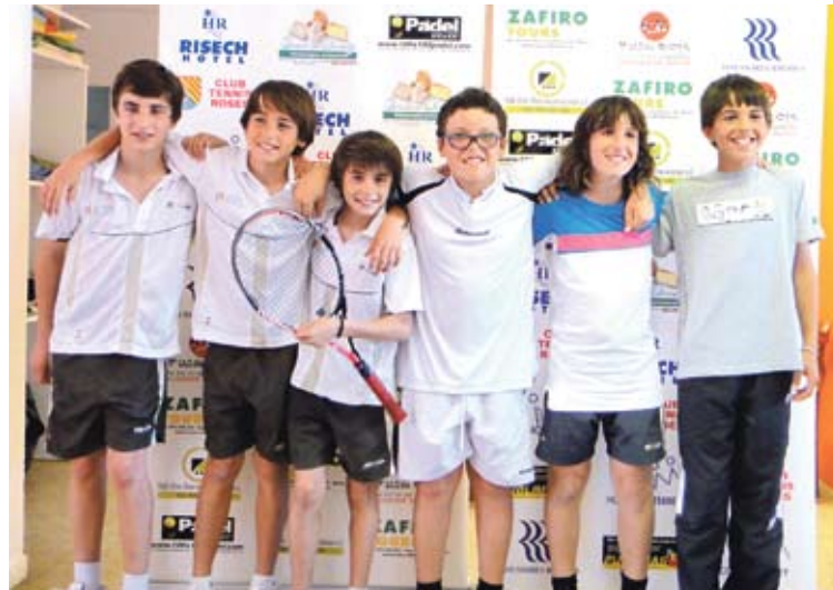
CAMPIONS. L'infantil del CT Roses va demostrar la seva qualitat