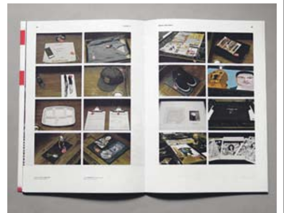
'L.A. INVISIBLE CITY'. Dues imatges del llibre guanyador d'un diploma de plata