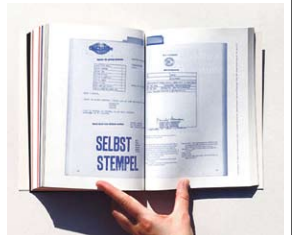
'SE BUSCA CURATOR'. Quatre de les composicions del llibre premiat