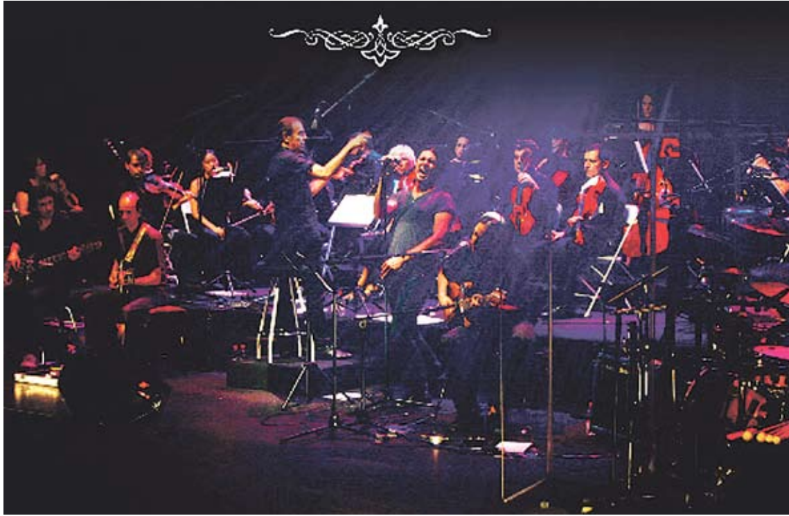
ROCK SIMFÒNIC. Les guitarres elèctriques es barrejaran amb violins i violes