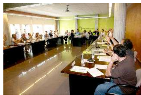
El ple del Consell es va reunir ahir per última vegada, foto d'arxiu. diari de girona

L'anunci d'una nova licitació de les obres de desdoblament de la Nacional II entre Caldes de Malavella i Sils aquesta setmana passada no ha aturat la pressió del Consell Comarcal de la Selva vers el Ministeri de Foment perquè desencalli tota la futura A2 al seu pas per la comarca.