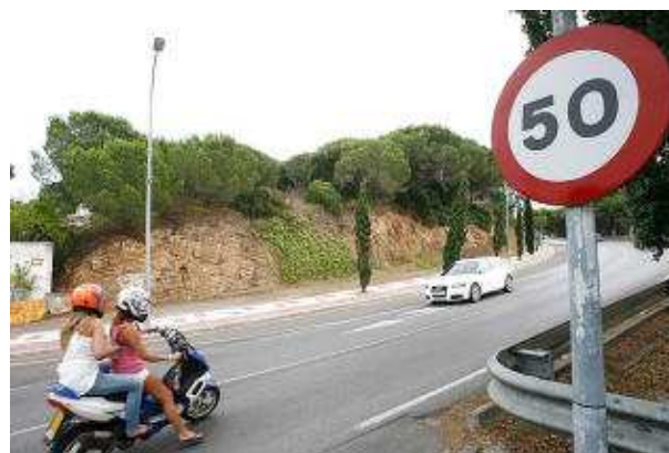
La part inferior de Puig Pinell, a l'alçada de l'antiga discoteca Pacha, serà urbanitzable. diari de girona

Cano s'ha mostrat "satisfet amb la feina" que s'ha realitzat per la redacció d'aquest POUM i ha volgut destacar