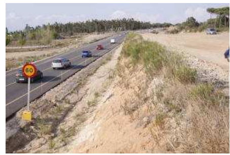
Un tram de la N-II al seu pas per Caldes de Malavella, en una imatge d'arxiu marc martí

GIRONA | DDG El Ministeri de Foment encara no té una data prevista per anunciar la licitació del tram entre Sils i Caldes de la N-II. El Consell de Ministres va anunciar el 29 d'abril que desencallava definitivament aquest tram de desdoblament a mig fer, des del juny del 2009, però no hi ha hagut cap moviment. Les previsions després del Consell de Ministres de fa un mes i mig passaven perquè l'anunci surtís publicat al Butlletí Oficial de l'Estat (BOE) i, d'aquesta manera, desencallar d'una vegada els tràmits administratius per poder reemprendre l'obra. No obstant això, la setmana passada va ser el mateix conseller de Territori i Sostenibilitat, Lluís Recoder, qui va informar que per part de l'Estat no hi ha "cap compromís" respecte la N-II després de reunir-se amb el secretari d'Estat d'Infraestructures de l'Estat, Víctor Morlán.