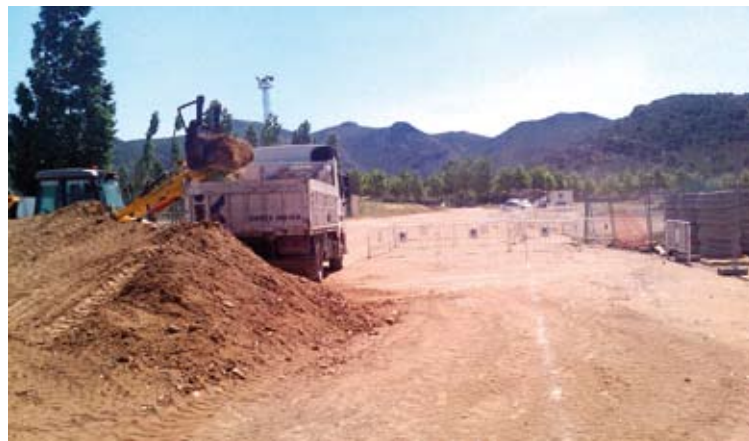
OBRES EN MARXA. A l'accés dels camps de la Vinyassa