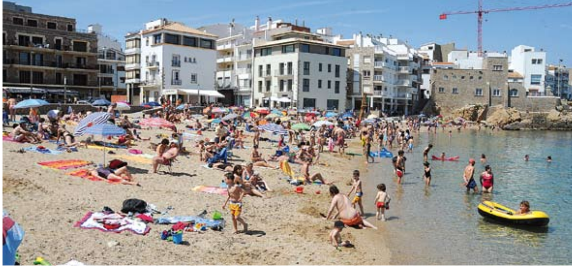
TRACTIU PRINCIPAL. El 14,5% dels turistes vénen atrets per les platges i el 10,7%, pel patrimoni natural