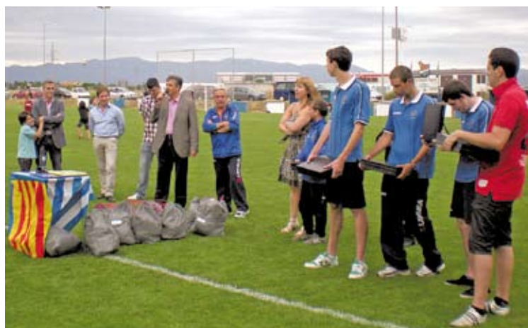
HOMENATGE. Els quatre juvenils i la infantil amb les plaques de record

■ La Peña Unionista Figueres va organitzar dissabte la festa de cloenda de la temporada amb la disputa de partits entre els diferents equips que integren l'entitat, que té la seva seu a Vilamallà. A la tarda es van homenatjar cinc jugadors del club que han de deixar la Peña per motius d'edat: quatre juvenils i una infantil. Al acte van assistir-hi l'alcalde de Vilamallà, Carles Álvarez, i el regidor d'Esports de l'Ajuntament de Figueres, Quim Ferrer, entre d'altres. ■