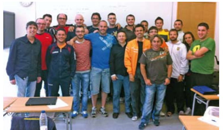
BANYOLES. Els assistents al curs d'entrenador de segon nivell HORA NOVA