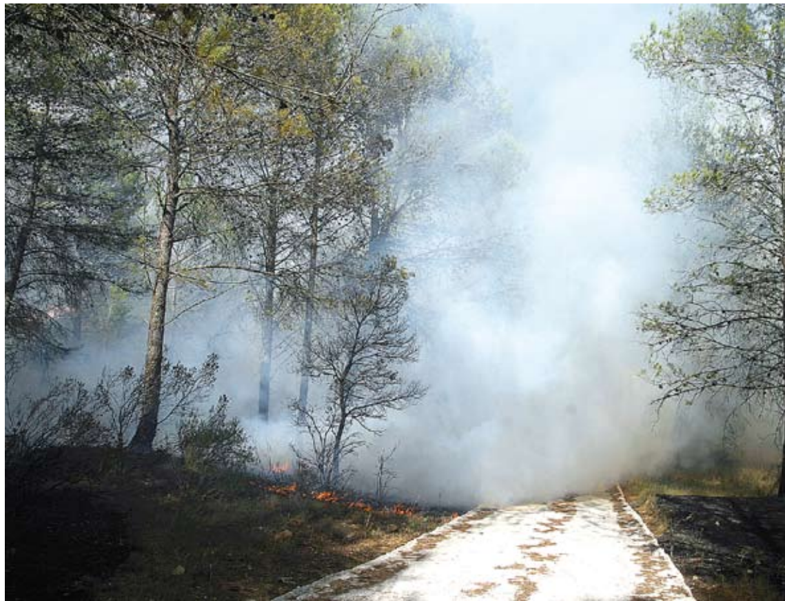
INCENDI DE CISTELLA AL 2006. L'estiu de fa 5 anys va ser devastador pel que fa a focs a l'Alt Empordà

La campanya d'estiu contra el foc comença aquest any el 15 de juny, és a dir, demà dimecres, i acabarà el 15 de setembre. Enguany destaquen les millores tecnològiques, les modificacions organitzatives i noves línies de treball per a la coordinació dels diferents col·lectius i cossos que intervenen en la prevenció i l'extinció d'incendis forestals. S'ha reforçat el dispositiu, especialment pel que fa a recursos humans. Enguany hi haurà 6.542 persones a tot Catalunya que treballaran contra el foc, 1.037 més que en anteriors