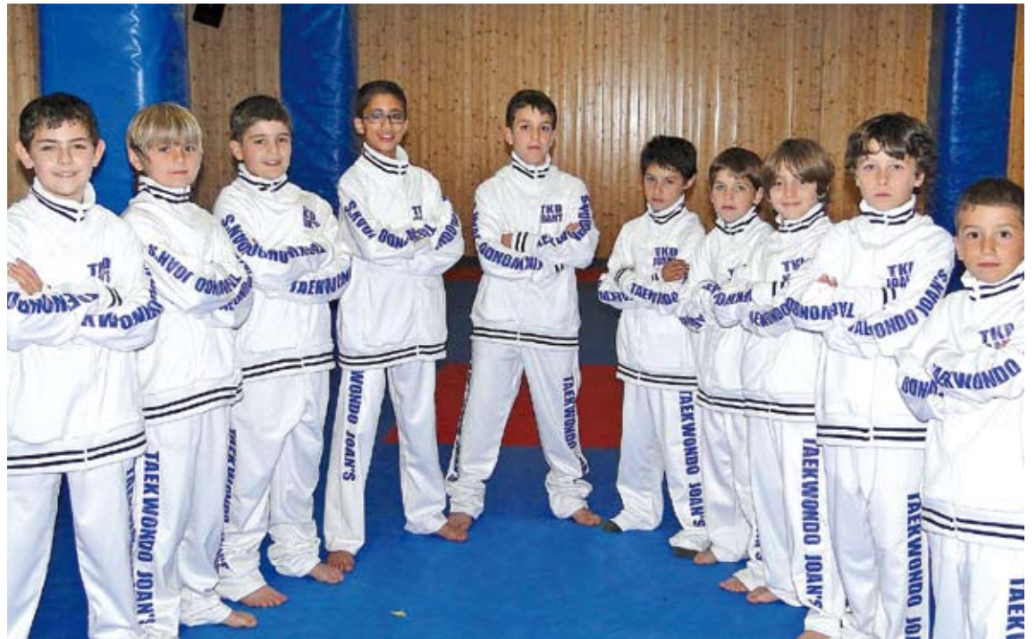
EL PLANTER. A la imatge els joves representants del TKD Joan's de Roses