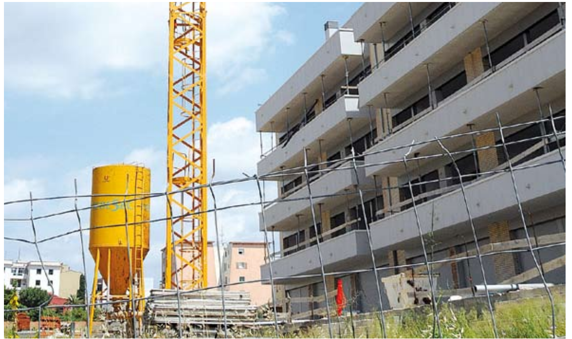
ANY 2011. El primer semestre d'aquest any ha estat el pitjor dels últims 20 anys

La situació actual del mercat immobiliari gironí es caracteritza per una gran varietat de preus, segons l'estudi. Així, Girona i Palamós (Baix Empordà) són els