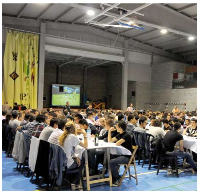
CLOENDA. El sopar va tenir lloc dissabte al pavelló de Vilamallà