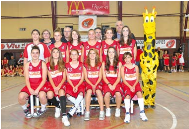
SEGONES. L'equip cadet femení va plantar cara a la final al Canovelles HORA NOVA