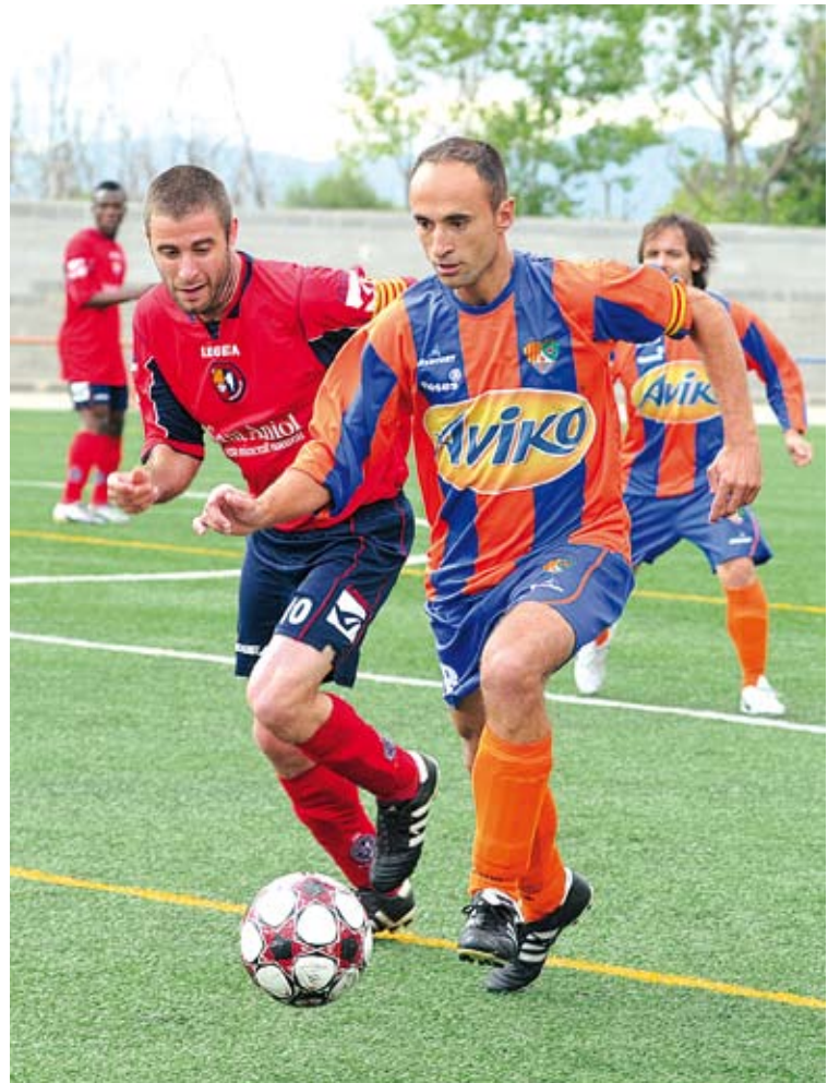
PAS FERM. El Roses es va imposar al campió de Primera Catalana, l'Olot ÀNGEL REYNAL

■ L'Agrupació Esportiva Roses va sorprendre dissabte el campió de Primera Catalana, l'Olot, i es va imposar per un ajustat 2-1 a la tercera eliminatòria de la Copa Catalunya. L'equip que entrena Gabriel Maragall va reaccionar a la represa després d'encaixar el 0-1 en el tram final del primer temps i va passar ronda gràcies als gols de Wolfrando i Hossni. ■