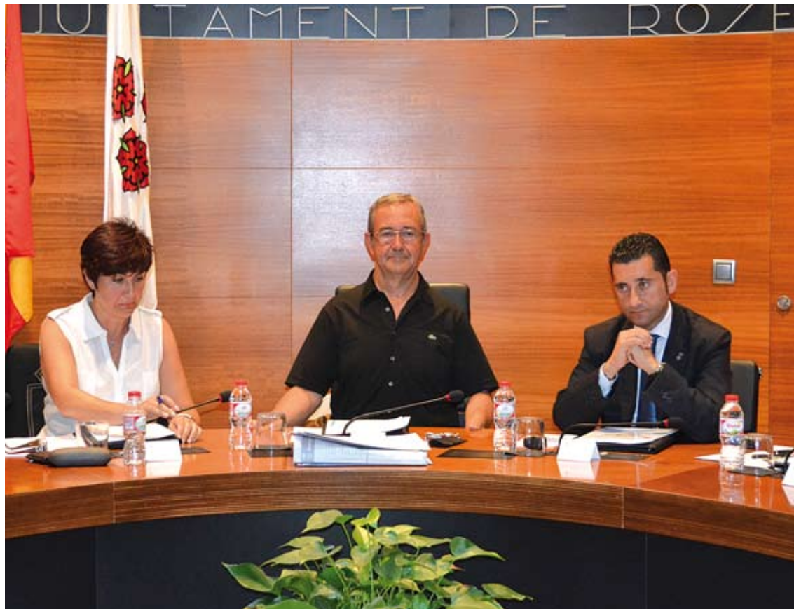
MINDAN, PÀRAMO I ESCOBAR. D'esquerra a dreta, la primera tinent d'alcalde, el batlle i el segon tinent d'alcalde (PP)

L'alcalde de Roses no cobrarà sou però sí per les assistències a plens, a comissions de govern i altres reunions relacionades amb el