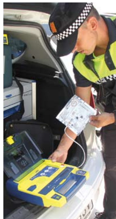
DESFIBRIL·LADOR. L'aparell a Roses

A més dels desfibril·ladors mòbils als cotxes patrulla, a l'Escala també hi haurà aparells fixos repartits per sis punts estratègics del municipi: als baixos de can Masset, al pavelló municipal, al camp de futbol, a l'accés a Cala Montgó, al Camp dels Pilans i a l'avinguda Riells. ■