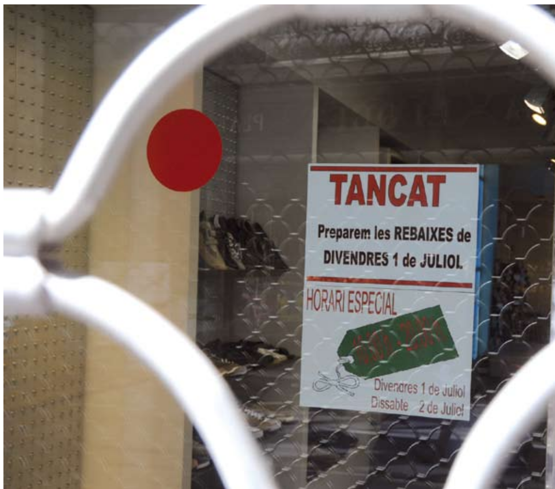
PREPARATIUS. Alguns comerciants han hagut de tancar per posar a punt els establiments per a les rebaixes