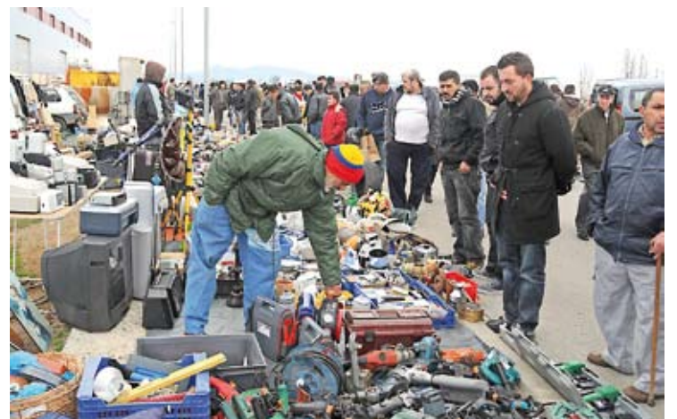
MERCAT DE LES PUCES. Comptava amb 400 parades cada diumenge