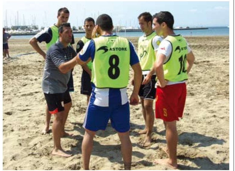
ENTRENAMENT. Una imatge de la preselecció que es va fer a Roses