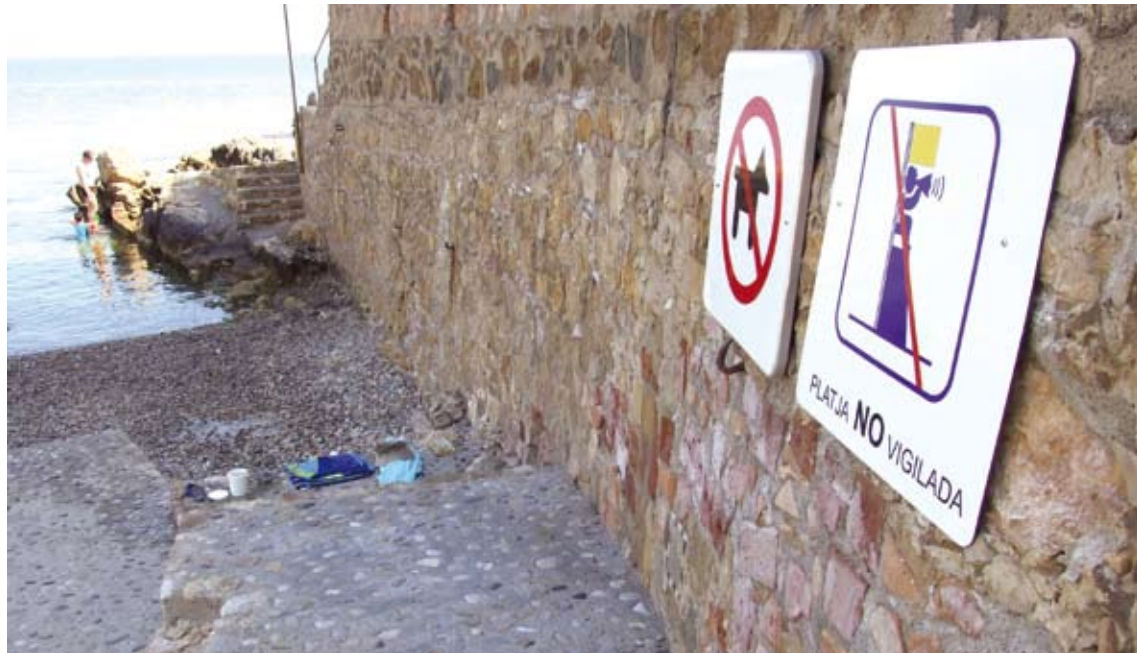
SENYALS. Els cartells relatius a la vigilància s'afegeixen als que prohibeixen la presència de gossos a algunes platges

■ Un total de 3.647 turistes han passat durant els darrers dos mesos per alguna de les Oficines de Turisme de l'Escala. En suma, es tracta d'un augment del 6,6% en el nombre de visites respecte de l'any passat pel que fa als mesos de maig i juny. El motiu principal d'aquest repunt, segons Carme Formatjé, tècnica de Turisme del municipi, és "l'horari d'atenció continuada" que durant tot l'any ofereixen les oficines. Però les estadístiques no només han crescut a causa d'aquesta ampliació horària, reivindica Formatjé. "Fa temps que s'està detectant el valor afegit d'una destinació com l'Escala, on els turistes busquen alguna cosa més que sol i plat-