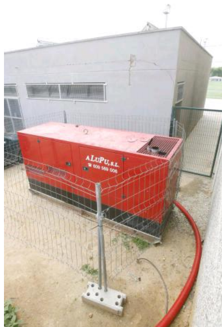
El generador, protegit per tanques en espera d'acabar les festes. aniol resclosa

Les entitats locals esperen amb candeletes les festes majors perquè suposen una important font d'ingressos. Durant l'hora en què la gent va marxar del polivalent i va prosseguir la festa a la carpa del costat, la UE Llagostera va deixar d'ingressar uns 2.000 euros en consumicions, calcula Rissech. I malgrat que el concert dels The Patillas va tornar a convocar el jovent i la festa va durar fins les sis, la caixa ho va notar, diuen des de l'entitat. A més, no és l'únic incident que han patit durant aquestes festes ja que la nit de dijous a divendres uns pispes van forçar la porta del polivalent i van endur-se'n caixes de whisky i vodka i també lots de llaunes de begudes energètiques.