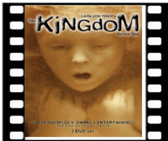
The Kingdom , Lars von Trier, 1994