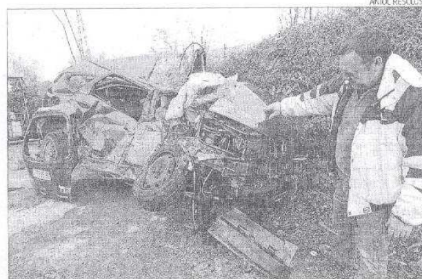
Turisme en què viatjava la víctima mortal de l'accident.