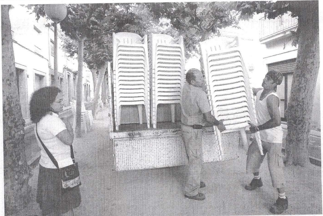
La brigada de Caldes de Malavella descarregant piles de cadires perquè tot estigui a punt per a les puntaires que exhibeixen les seves arts per la festa major.