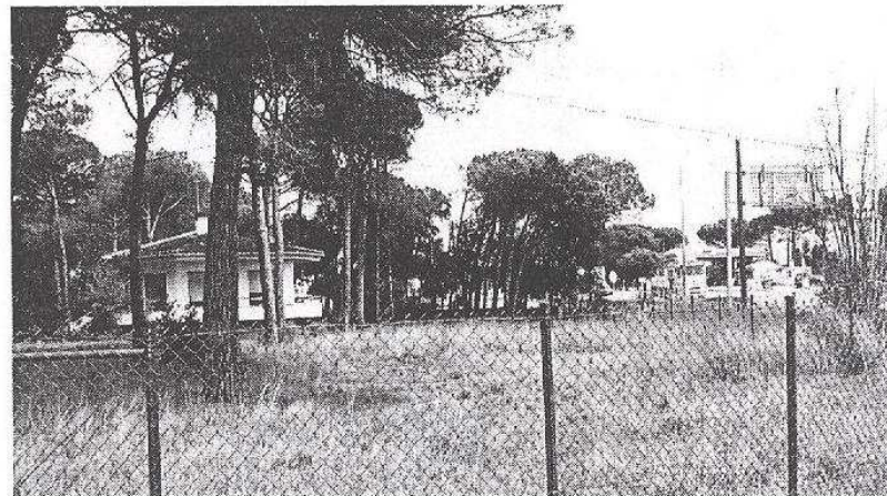
► La casa. Situada a la urbanització Els Tapiots, és a tocar de la carretera. L'edifici està dins una finca de 4.000 metres quadrats de pins. Des de fa dos anys viuen amb l'angoixa que hauran de fer les maletes i deixar la casa on han viscut sempre. / A.P.