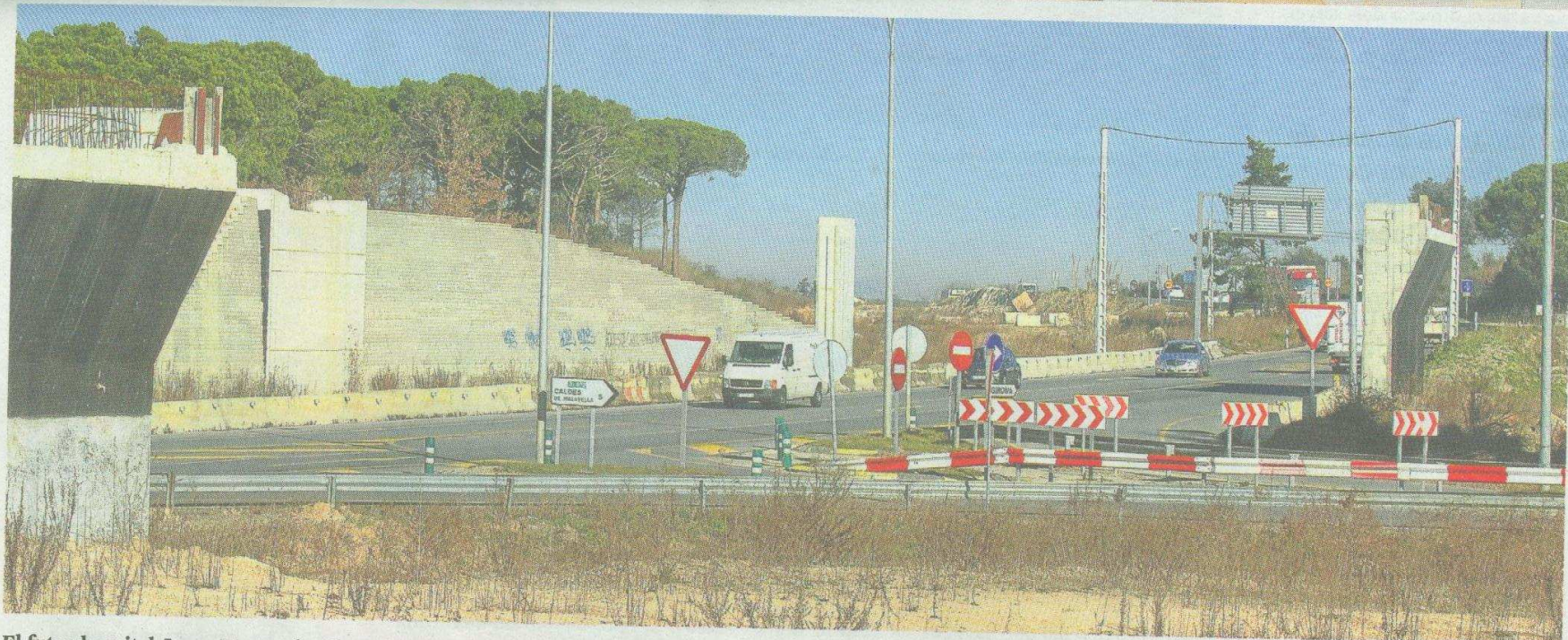
El futur hospital Josep Trueta de Girona i les obres de la carretera N-II són dos dels grans projectes que s'han vist afectats per la manca de finançament