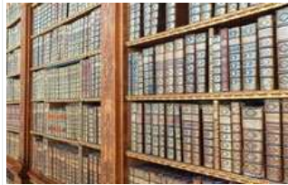
Les jornades combinen literatura i gastronomia de la zona

Les jornades, amb el títol El Gust de la Paraula, comencen el divendres amb una vinoteca, seguida de contes gastronòmics i un taller de pa termal per als més petits el dissabte al matí. Durant el dissabte podeu participar en un concurs de cuina popular dedicat a Josep Pla o degustar plats tradicionals catalans presents en diferents textos literaris.