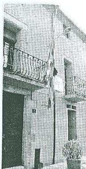
La senyera, a mig pal i amb crespó negre.

● A causa de la tragèdia, l'Ajuntament de Caldes de Malavella va celebrar ahir al migdia un ple extraordinari, en el qual es va decidir decretar tres dies de dol oficial al municipi. A banda, la senyera que hi ha al balcó de l'edifici consistorial oneja a mig pal i du un crespó negre. Si s'arribessin a confirmar les sospites dels Mossos d'Esquadra, aquest seria el segon cas d'infanticidi a les comarques gironines en només tres mesos. Al setembre, els mateixos Mossos van detenir una dona de 43 anys acusada d'haver degollat la seva filla de 6 anys al barri de Can Gibert del Pla de Girona. La sospitosa, amb antecedents per trastorns psíquics, va admetre l'autoria del crim i va confessar que havia matat la filla perquè es volia suïcidar i es volia endur qui més estimava. Encara no fa un mes, un veí de Sabadell també va matar a ganivetades el seu fill, de 7 anys, i després es va suïcidar.