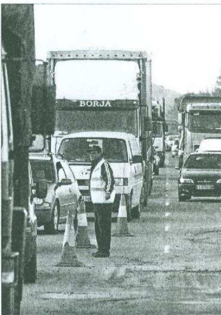
A CONTRARELLOTGE. Els treballadors encara estaven col·locant ahir nombroses valles.