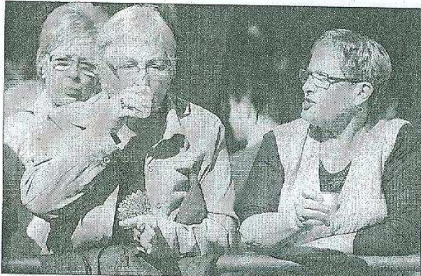
TAST. Els assistents van poder beure aigua de Caldes, que fou oferta en vasets.

dues demandes. Per una banda, se sol·licita a l'Ajuntament que intercedeixi a fi de «defensar i aconseguir els drets sobre l'aigua». I, per l'altra, s'instà que les empreses que ara estan enfrontades tinguin «seny» i fagin servir la «capacitat de diàleg» per fer «compatible» l'activitat dels balnearis i els