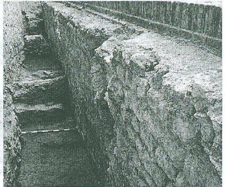
El mur de llevant de les termes, vist des de l'exterior.

Les excavacions que s'estan fent formen part de la