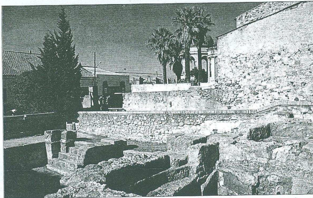
EL JACIMENT. Les restes dels banys romanes de la vila s'han anat degradant els darrers anys.

El projecte de recuperació de les termes de Caldes ha superat el preceptiu pas per la Comissió del Patrimoni. Ara l'Ajuntament ha d'obtenir el suport econòmic