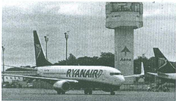
Ryanair ha estat el dinamitzador de l'aeroport.