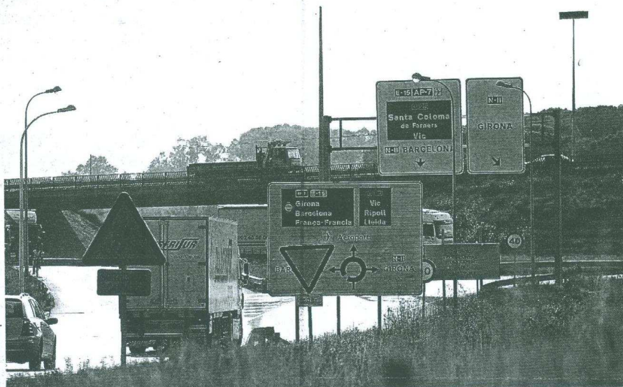
L'N-II, l'Eix Transversal, l'autopista i l'aeroport són grans infraestructures que conflueixen en el «trapezi d'or».

Una dècada després, no hauríem de parlar de «trapezi» ja que s'haurien d'incloure les poblacions de Maçanet i Vidreres. Dels punts que es proposaven, alguns s'han fet realitat: l'activitat industrial a