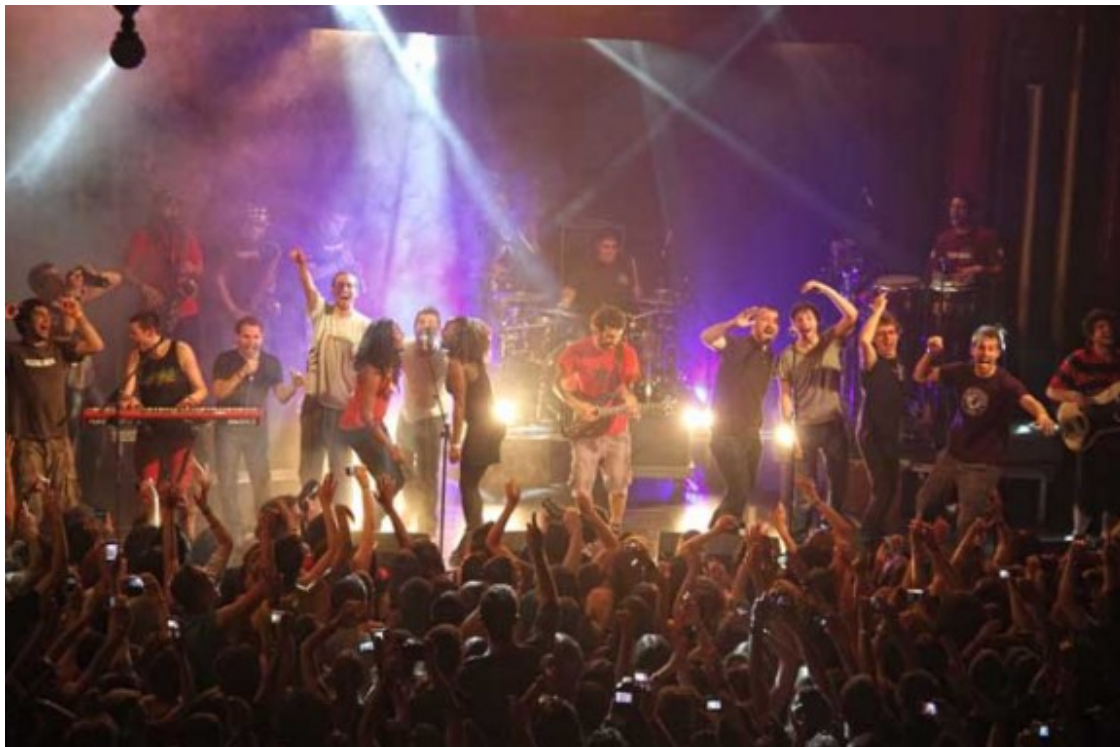
Txarango i amics cantant