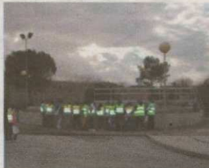
SISTEMES DE SANEJAMENT DEL CONSELL COMARCAL DE LA SELVA

JUNY 2012 · EDITA: CONSELL COMARCAL DE LA SELVA, ÀREA DE COMUNICACIÓ · PASSEIG DE SANT SALVADOR, 25-27 · SANTA COLOMA DE FARNERS · WWW.SELVA.CAT