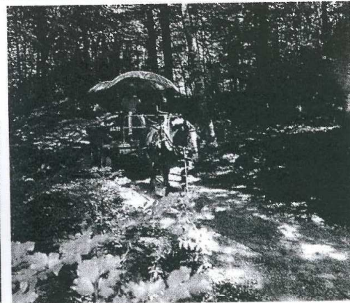
A la fotografia de dalt, la piscina del Balneari Prats, situada a Caldes de Malavella. A baix, una de les residències cases de pagès que es poden trobar a les comarques gironines, en aquest cas, a Sant Julià del Llor, i turistes passejant per la fageda d'en Jordà, al municipi de Santa Pau.

cietat catalana, després d'uns anys en què, tot i mantenir una clientela fidel, semblaven haver passat de moda. La necessitat de fer tractaments que ajudin a treure's de sobre l'estrès, els beneficis en general de les aigües termals i el culte al cos, en augment dia a dia, conjuntament amb una forta modernització i innovació tecnològica dels balnearis, han portat l'activitat a recuperar les afluències que havia tingut en els anys