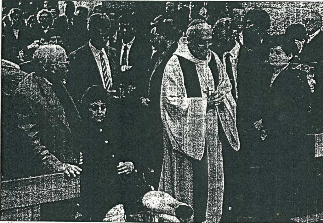
El bisbe de Girona, Jaume Camprodon, en el moment d'entrar a l'església. Al seu costat, una de les persones ferides.

dels parents de les víctimes i va recordar que dotze famílies s'han quedat sense casa. La Guàrdia Civil vigila el bloc de pisos enrunat per evitar que s'hi entri, pel perill d'ensorrament.