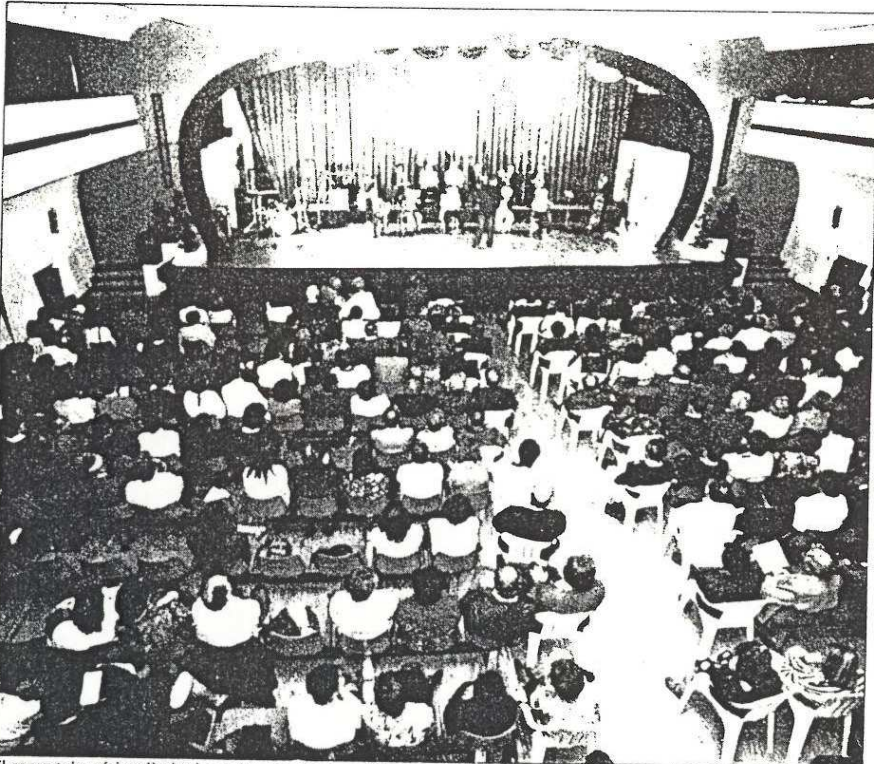
El concert de música clàssica i popular, organitzat per l'Agrupació de Sardanistes, va recollir unes 400.000 pessetes.