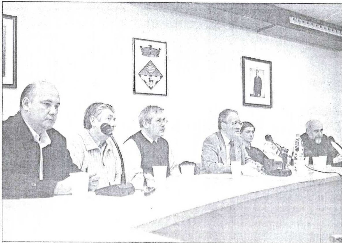
Reunió. Els alcaldes s'han trobat en diverses ocasions per l'afer de desdoblar la N-II.