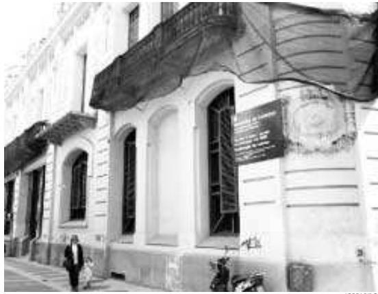
El edificio del casino Menestral se encuentra actualmente muy degradado

La aportación municipal de 250 millones se repartirá en diez anualidades, a partir del próximo año. "A medida que vayamos recibiendo el dinero iremos ejecutando las obras, empezando por aquellas que deben servir para mejorar la seguridad del