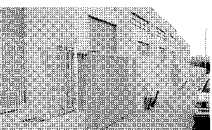
SILS, Polígon Industrial Naus amb pati de càrrega i descàrrega. Entrada camions. Estructura de formigó. Ref. H625