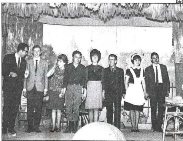
Repartiment dels seixanta. Els actors saluden després de la representació.

ha anat a càrrec de la mateixa formació i, segons va explicar el seu president, no disposen de cap aportació municipal. A part dels ingressos que generen les seves actuacions, el Grup Transpunt compta amb una subvenció de la Diputació de Girona valorada en 40.000 pessetes per actuació.