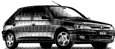
3 15 PORTES