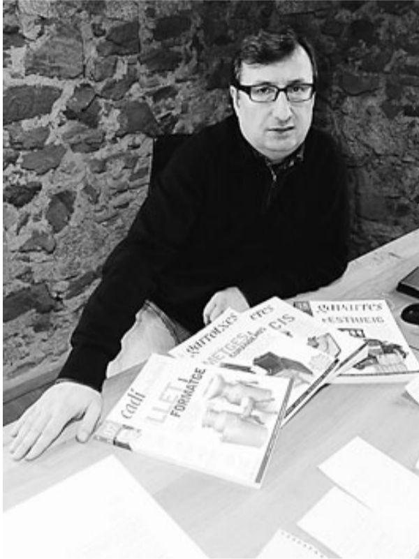
Madrià, amb les quatre revistes del grup editorial. / O.M.

—El model de revista és el mateix. —«Tenen una funció clara, que és la de recuperar la memòria oral, el patrimoni, parlar amb gent anònima que