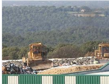
L'abocador de Solius podrà emmagatzemar més volum de residus.