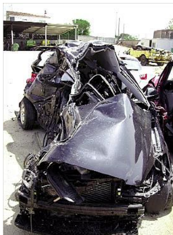
El cotxe del jove de Breda, totalment destrossat. carles colomer

Amb aquesta mort, en només tres dies a les carreteres de les comarques gironines hi ha hagut quatre víctimes mortals en accidents de trànsit i de començament d'any ençà ja se sumen 49 morts a la demarcació. En concret, un noi de 22 anys de Llagostera va morir la matinada de diumenge en un accident de trànsit a la carretera de Caldes de Malavella i dissabte, també a la matinada, dos ciutadans francesos, un home de 27 anys i una dona de 41, van morir poc abans de les onze de la nit, quan un camió va envestir el cotxe en què anaven a la Nacional II, a l'altura de Biure (Alt Empordà).