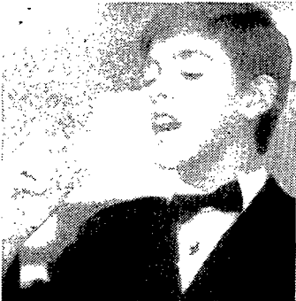
Los niños de la suerte

En Valladolid recayó una serie de otro quinto premio, el correspondiente al número 30.714, distribuido en la administración número 10 de la calle Duque de la